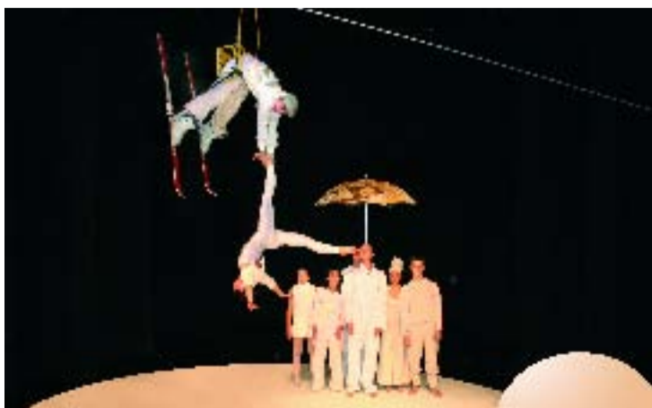
"Circus Klermer", el Circ d'Hivern del 2004.