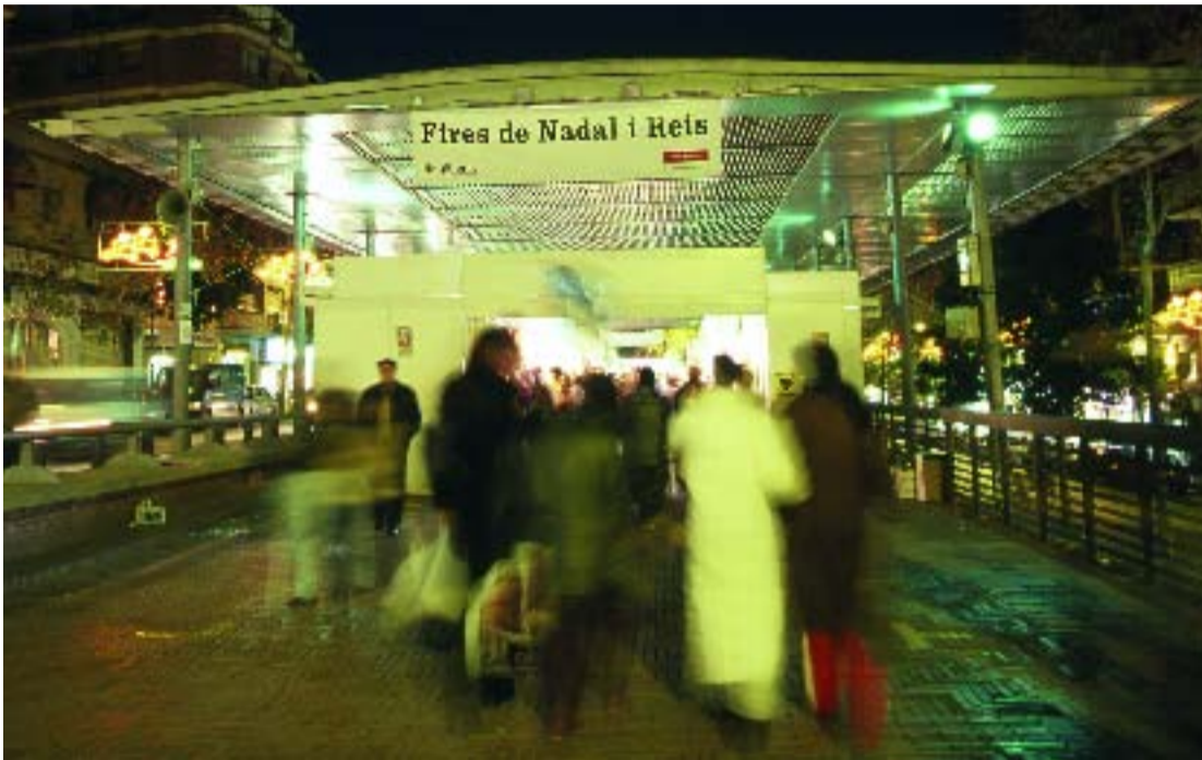
La marquesina de Via Júlia acollirà una nova edició de la Fira de Nadal.