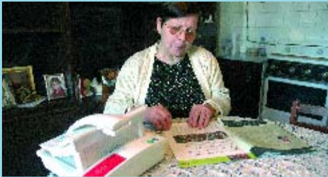
El servei de teleassistència funciona les 24 hores del dia.