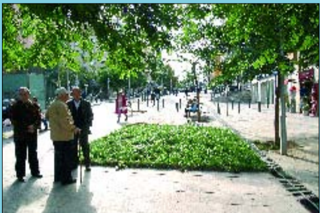
Ara La urbanització del carrer Pablo Iglesias entre els carrers d'Argullós i Flor de Neu, el convertí en un bulevard.