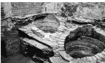
Figura 2 Vista de conjunt dels dos dipòsits.