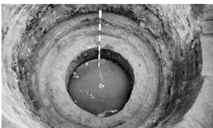
Figura 3 Detall del clot situat a la banda de ponent.