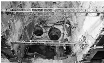
Figura 1 Vista general del solar amb les restes arqueològiques localitzades.