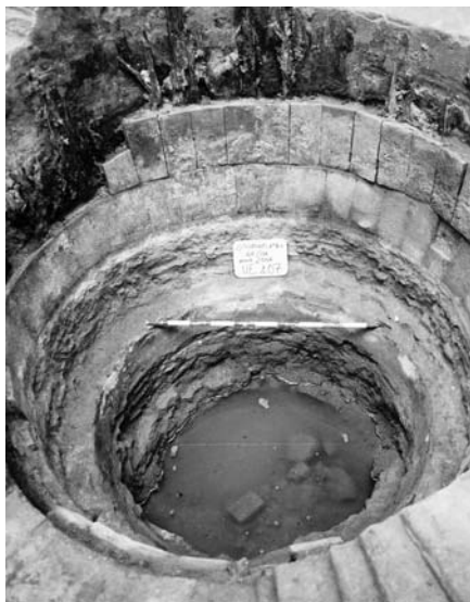
Figura 4 Detall del dipòsit ubicat més a l'est. En la imatge podem veure els dos revestiments del seu interior, una capa de rajoles i una de fusta.

tava al carrer del Portal Nou i al de Tiradors. Un cop finalitzades les obres, concretament el 21 de gener de l'any 1857, 7 Molins va vendre l'edifici a Ramon Torrents pel preu de 14.400 pessetes. Tan sols un any més tard, el mateix Molins va vendre la segona designa a Andreu Alier, d'ofici adobador, el qual va satisfer un preu de 500 duros de plata en moneda espa-nyola. 8 El protocol notarial, que data del mes d'abril del 1858, descriu l'edifici amb els mateixos termes que els documents anteriors. No obstant això, les afrontacions mencionen la propietat de Ramon Torrents com a límit occidental de la finca, fet que evidencia novament la separació de les dues designes que abans havien constituït un únic edifici.