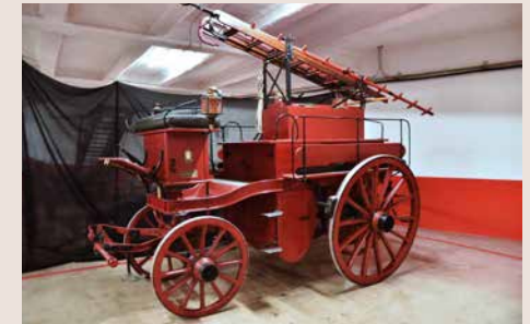
Hipofurgó 1892. Adquisició de 1892. Fabricació francesa. Vehicle dissenyat originalment per a la Brigade des Sapeurs-Pompiers de París. Bombers de Barcelona en va comprar tres, un per a cadascun dels parcs principals. ABB