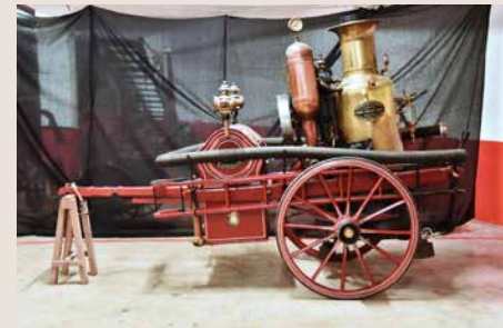
Merryweather Valiant II 1896. Adquisició de 1896. Fabricació anglesa. Bomba d'incendis de vapor lleugera amb un cabal de 900 l/m. Calien un mínim de dos bombers per desplaçar-la. ABB