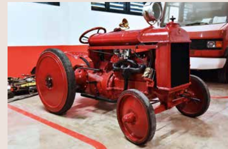
Tractor 1922. Adquisició de 1922. Fabricat a la factoria de Ford Hispania a Barcelona amb peces importades dels Estats Units d'Amèrica. Per transportar-hi escales i bombes de vapor arran de la supressió del servei de cavalleries. ABB