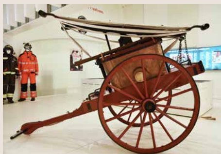
Bomba MTM 1875. Adquisició de 1875. Bomba manual d'incendis fabricada per la Maquinista Terrestre i Marítima a partir d'un model francès. Per aspirar aigua directament d'una bassa o canal. Té un dipòsit que es pot omplir amb galledes d'aigua. ABB