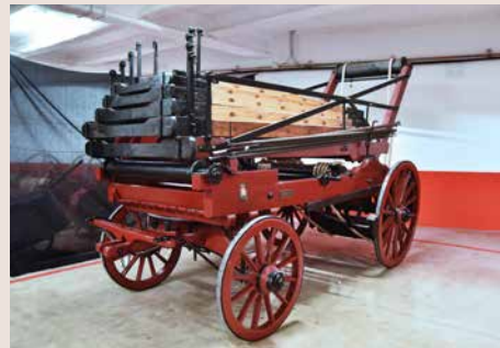
Escala Porta 1879. Adquisició de 1879. Fabricació italiana. Primera gran escala de Bombers de Barcelona. ABB