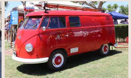
W BT 19 1955. Adquisició de 1955. Furgoneta Volkswagen T1 equipada per l'empresa Kronenburg amb una bomba d'alta pressió per apagar petits incendis. Es va fer servir a la caserna interior de la Fira de Mostres de Barcelona. ABB. El vehicle a l'exposició pertany a la col·lecció privada Marcos Navarro.