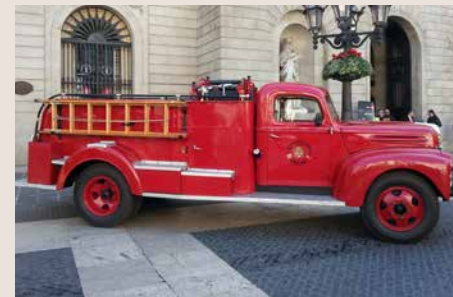
Bt7 1948. Adquisició de 1948. Excedent de material de guerra de l'exèrcit dels Estats Units d'Amèrica. Camió dissenyat especialment per lluitar contra incendis de combustible líquid als aeroports de campanya. ABB