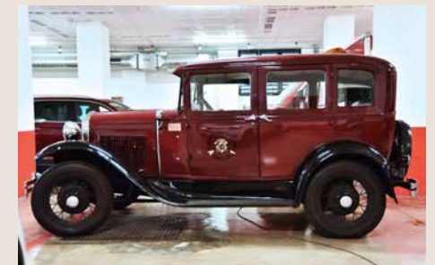
Ford A1 1929. Adquisició de 1929. Fabricat a la factoria de Ford Hispania a Barcelona amb peces importades dels Estats Units d'Amèrica. Cotxe per als comandaments de Bombers de Barcelona. ABB