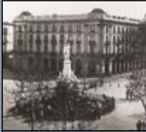
Barcelona i els indians. Negocis d'ultramar i canvi urbà, 1835-1916