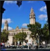
Sis-cents anys de correu a la ciutat de Barcelona. De l'edat mitjana al segle XXI

Itinerari d'autor a càrrec de Josep Grau . 5/4/2020 . Iníci: pl. Catalunya (centre plaça). 7,5 € (Amics: 5 €)