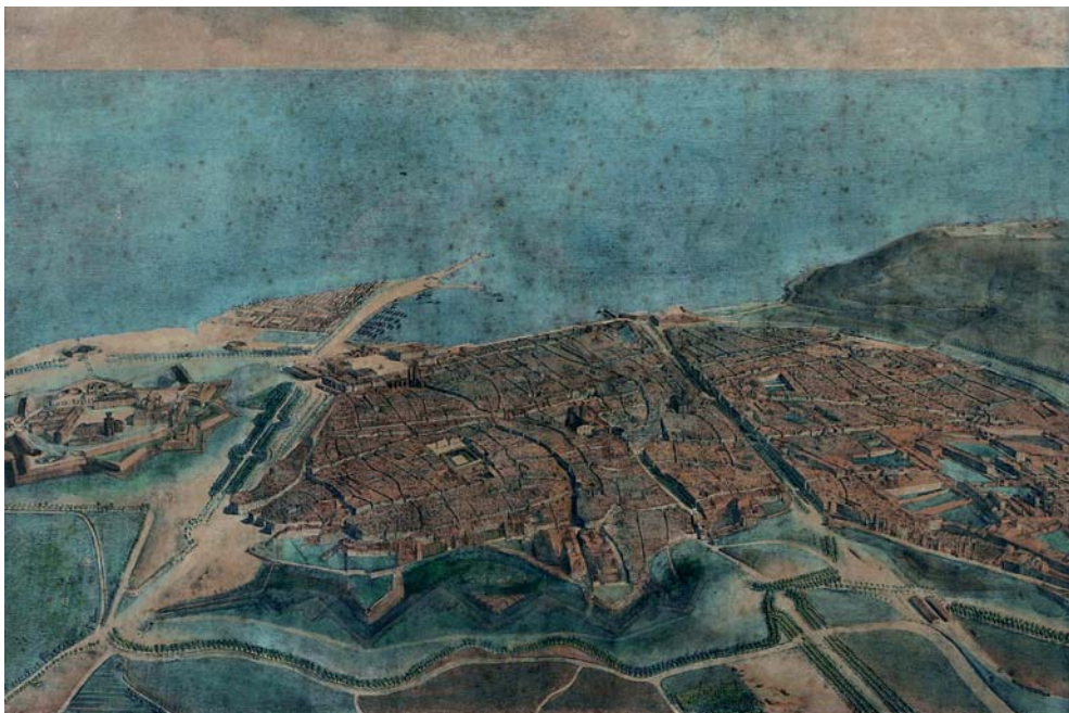
Vista aèria de Barcelona d'Onofre Alsamora, 1860

Del 18 de juliol de 2009 al 10 de gener de 2010