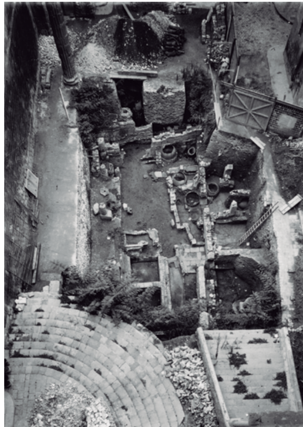
Excavaciones de la plaza del Rei, 1935.

El museo muestra también la evolución de la Barcelona medieval con una exposición permanente en el espacio del palacio condal del siglo XIII. Un nivel más arriba, el visitante puede ver el Salón del Tinell y la Capilla de Santa Ágata, ambos del siglo XIV, espacios del Palacio Real Mayor que, junto con la Sala Padellàs, acogen las exposiciones temporales del museo.