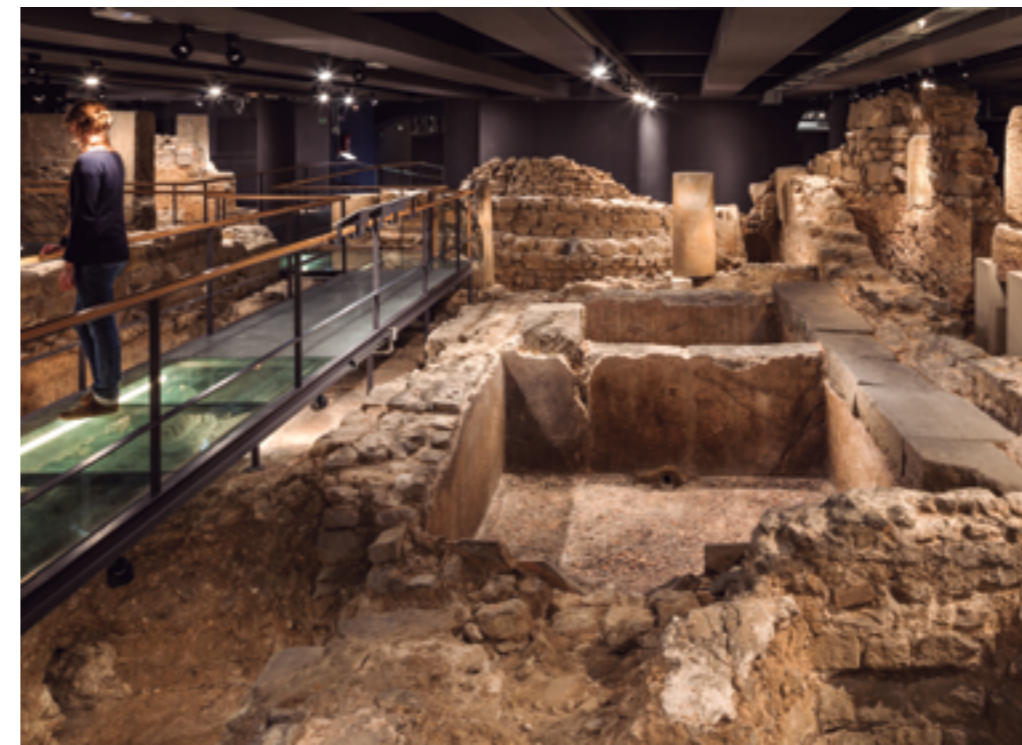
Cetaria. Factoría de salazón de pescado y garo. Siglo III d. C.

En la ciudad se localizaban edificios públicos como las termas, los colegios y las asociaciones profesionales y, sobre todo, las domus de las familias más importantes (MUHBA Domus Avinyó y MUHBA Domus Sant Honorat). También había tiendas, talleres y algunas ins-