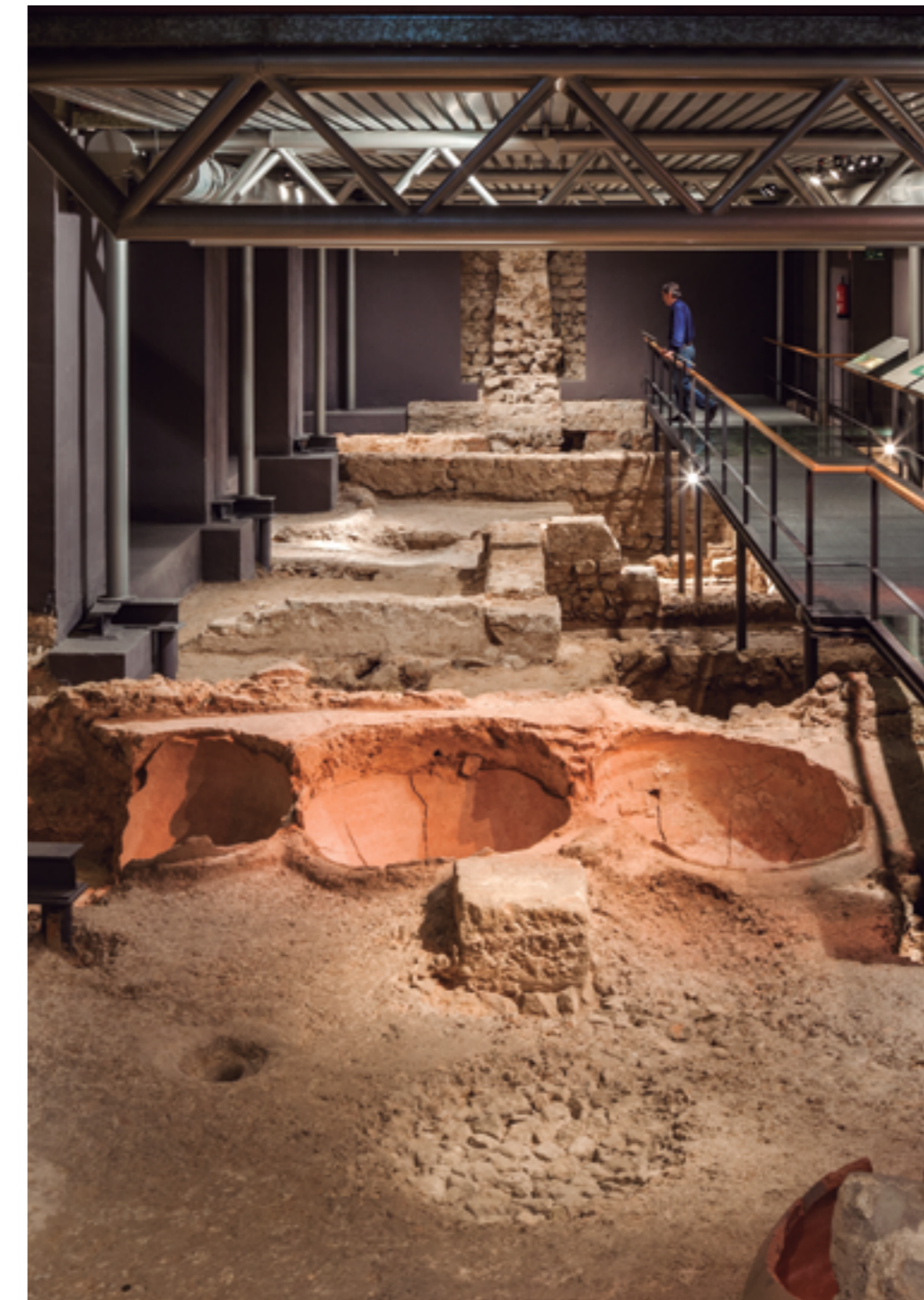
Cella vinaria de la instalación vinícola. Siglo III d. C.

En las distintas salas expositivas del recorrido pueden verse cerca de trescientas piezas del siglo I al IV.