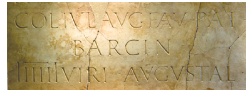
Placa epigráfica con el nombre Barcino. Mármol blanco de Luni Carrara (Italia). 110-130 d. C.

Desde el año 1931 y hasta la Guerra Civil se llevaron a cabo excavaciones arqueológicas en el espacio que tenía que ocupar la casa gótica de Clariana-Padellàs (actual sede del museo), trasladada a la plaza del Rei desde la calle de Mercaders a raíz de la apertura de la Via Laietana. Estas intervenciones permitieron descubrir los restos de una parte importante de la antigua colonia romana de Barcino . En el año 1943 se abrió el Museo de Historia de la Ciudad, que incorporaba parte del subsuelo arqueológico descubierto en los años treinta, el Salón del Tinell del Palacio Real Mayor, redescubierto en el año 1936, y la Capilla de Santa Ágata. En el año 1944, en la calle de Els Comtes se descubrió parte de la primitiva sede episcopal, y en el año 1968, su baptisterio.