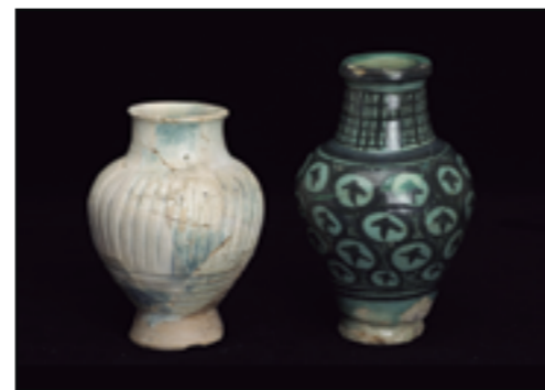
Albarels procedents de Síria. Segle xiii.

Es tracta de l'impressionant Saló de Paraments, conegut actualment com el Saló del Tinell, projectat per Guillem Carbonell. Les obres es van dur a terme entre 1359 i 1370 i és un dels millors exemples del gòtic civil català, amb els grans arcs diafragmàtics que possibiliten espais molt amplis sense columnes. Al segle xvi va esdevenir Sala de les Escrivanies de la Reial Audiència, excepte el petit sector meridional, que amb una bona part del conjunt palatí va allotjar el Tribunal de la Inquisició. A partir de 1722 i fins a l'inici de la Guerra Civil l'any 1936, l'espai va acollir l'església del monestir