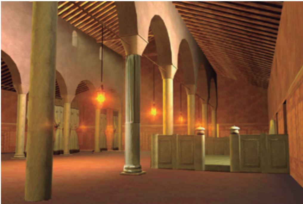
Restitució de la sala de recepció del bisbe. Segle v. Hipòtesi de Ch. Bonnet i J. Beltrán de Heredia. Dibuix 3D: Centum