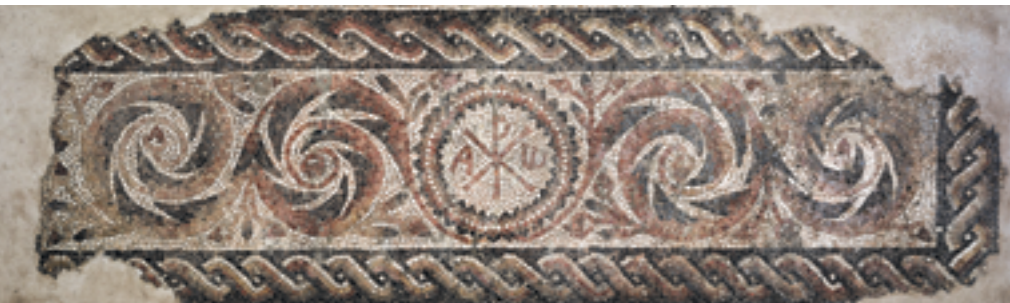
Lauda funerària. Mosaic. Segle v dC.