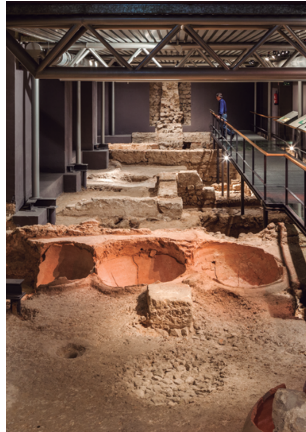
Cella vinaria de la instal·lació vinícola. Segle III dC.