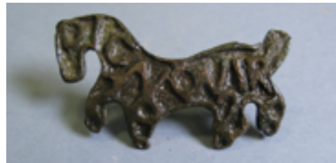
Anell amb segell de bronze en forma de cavall i amb la inscripció DICNO VIR, 'A l'home digne'. Peça d'ús cerimonial vinculada al bisbe. Segle v

El grup episcopal catòlic, que data del segle vi, es localitzava a l'actual Basílica dels Sants Màrtirs Just i Pastor. Se'n conserva la basílica, un baptisteri en forma de creu i una tomba monumental, segurament d'un bisbe. Les restes arqueològiques es poden visitar a l'interior de la parròquia. Les dues estructures episcopals van perdurar fins que els arrians van adoptar el catolicisme durant el Concili de Toledo de l'any 589. Al subsol arqueològic del museu, l'exposició Barcino a l'antiguitat tardana. El cristianisme, els visigots i la ciutat , amb unes 120 peces dels segles v-vii, ens apropa a aquest període.