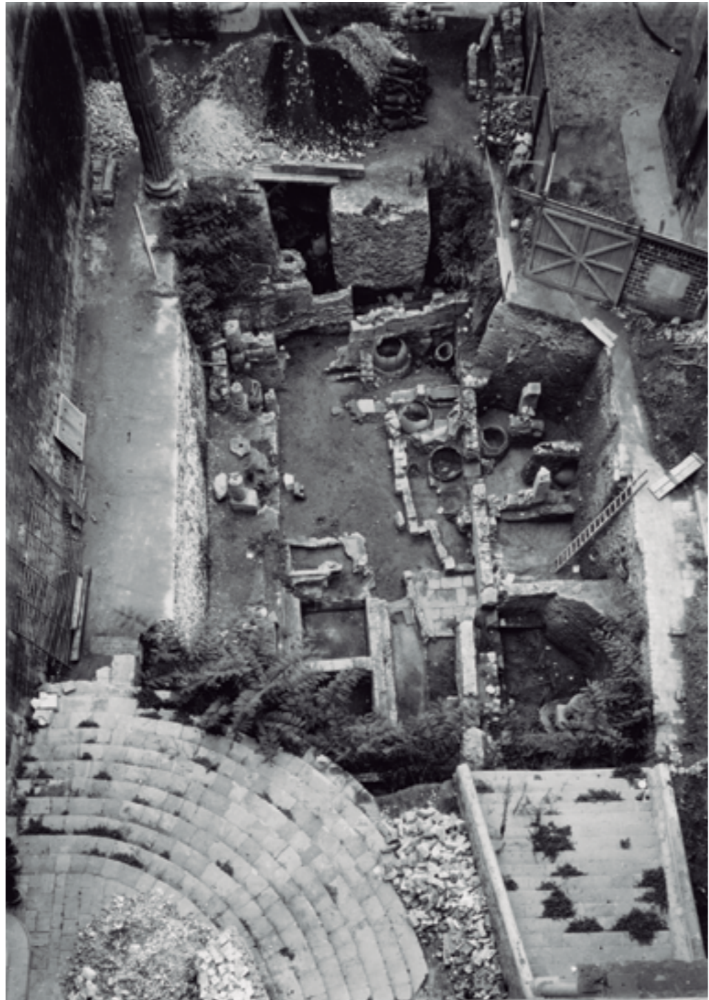
Excavacions de la plaça del Rei, 1935.