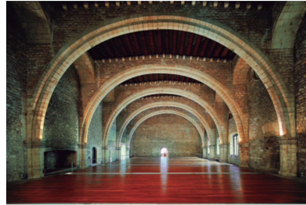
Saló del Tinell.

benedictí de Santa Clara. El 1937 l'enderroc de l'església va permetre redescobrir el Saló del Tinell, que posteriorment va ser restaurat.