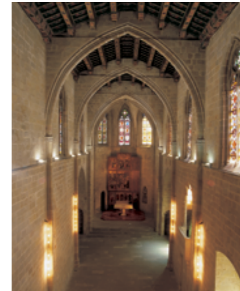
Capella de Santa Àgata del Palau Reial Major. Al fons, Retaule del Conestable o de l'Epifania, de Jaume Huguet (1450).

Les reformes de Pere el Cerimoniós i altres de posteriors, i l'enderrocament de l'avantcambra al segle xix (l'actual és una reconstrucció historicista del segle xx), han deixat com a únic testimoni de la primitiva obra gòtica de Jaume II la Capella Reial, coneguda actualment com a Capella de Santa Àgata. Aixecada sobre la muralla romana entre 1302 i 1318, hi destaquen la coberta de fusta policromada i el Retaule de l'Epifania , pintats als anys seixanta del segle xv per Alfonso de Còrdova i Jaume Huguet, respectivament, a petició del nou rei, Pere de Portugal. Tancada al culte l'any 1835, va ser el primer edifici considerat monument nacional (1866) i va acollir el Museu Provincial d'Antiguitats entre el 1877 i el 1932.