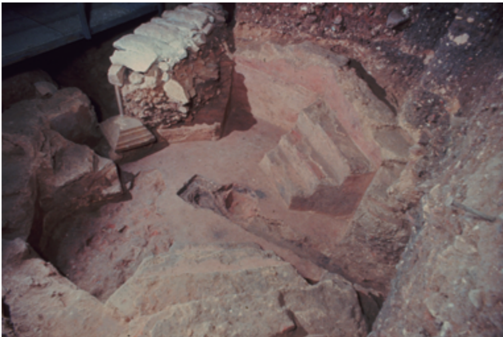
Baptisteri localitzat a sota de la catedral. Segle v.