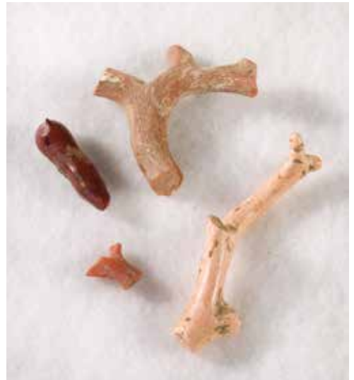
Fragments de corall trobats en excavacions arqueològiques del Call, MUHBA.

El vestigi patrimonial més famós del Call és la làpida que avui es pot veure encastada en la casa del carrer de Marlet, 1. La làpida que ara hi ha és una còpia de l'original, que es guarda al MUHBA. El text, en hebreu, commemora la creació d'una fundació benèfica per part d'un dels prohoms del barri a mitjan segle XIII, el rabí Samuel ha-Sardí.