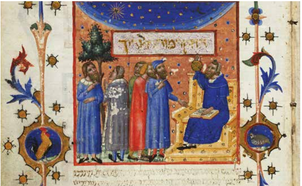
Detall de la Guia dels perplexos de Maimònides: científics discutint les lleis de la natura, s. xiv. Kongelige Bibliotek, Copenhaguen.

El darrer gran pensador del Call va ser el filòsof Hasday Cresques, persona amb moltes connexions amb la cort que després de la desfeta del 1391 va intentar sense èxit restaurar el Call i l'aljama de Barcelona. Es considera el segon filòsof jueu medieval més important, després de Maimònides.