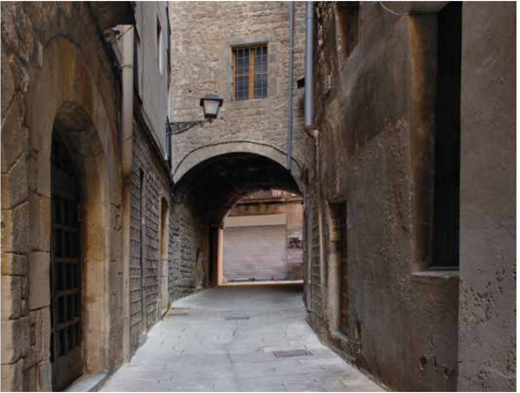
Carrer de la Volta del Remei.

El vestigi patrimonial més famós del Call és la làpida que avui es pot veure encastada en la casa del carrer de Marlet, 1. La làpida que ara hi ha és una còpia de l'original, que es guarda al MUHBA. El text, en hebreu, commemora la creació d'una fundació benèfica per part d'un dels prohoms del barri a mitjan segle XIII, el rabí Samuel ha-Sardí.