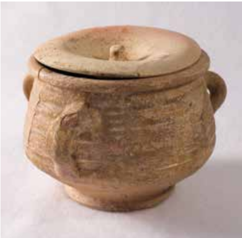
Olleta amb tapadora, s. XIII, MUHBA.

Àmbit III: Mostra el llegat cultural del Call. Una taula central permet tenir una visió global d'aquest llegat a través dels segles i fins avui. Sengles apartats són destinats a les tres personalitats o autors més sobresortints d'entre els molts erudits que van viure al Call: Abraham bar Hiyya, Salomó ben Adret i Hasday Cresques. L'interactiu La Gran Biblioteca descobreix al visitant les vint obres principals que es van escriure al Call entre els segles XI i XIV, algunes de les quals, veritables clàssics del pensament jueu.