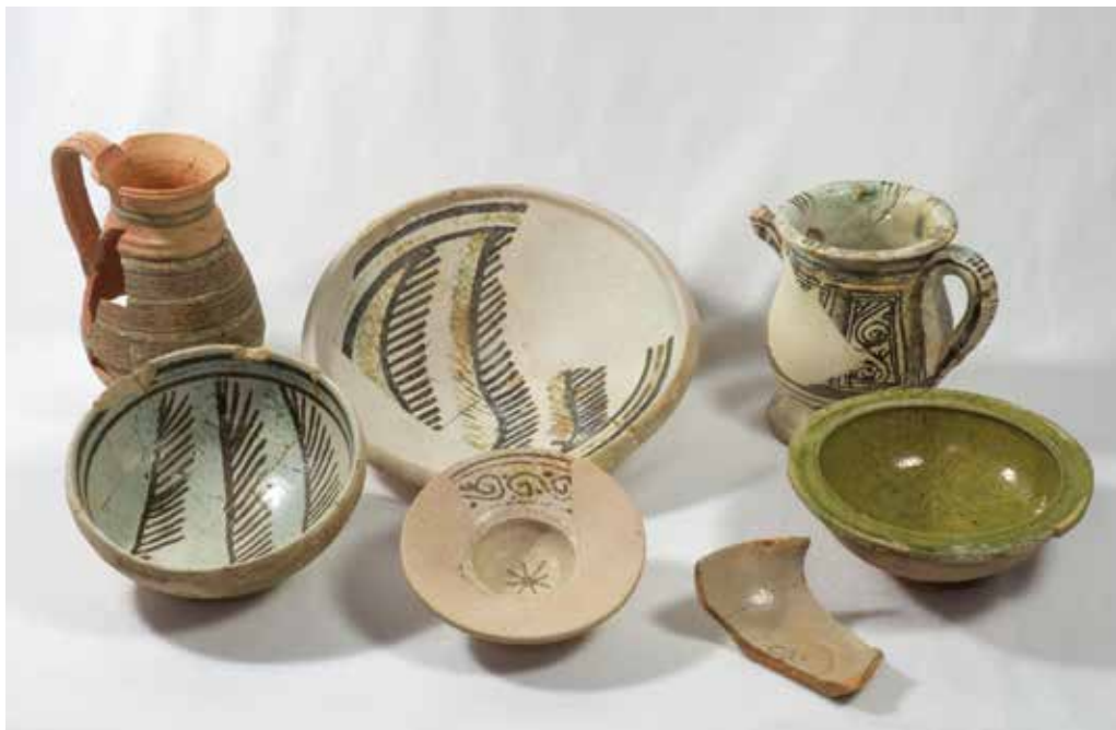
Pisa trobada al Call, s. xiii-xiv, MUHBA.

Però això no ha fet desaparèixer la traça de jueria medieval en la ciutat actual. La trama urbana es manté en la seva major part i hi ha carrers que conserven tot el regust del passat, com els de Sant Domènec del Call, Marlet, Fruita, Arc de Santa Eulàlia o Volta del Remei. Les excavacions arqueològiques han permès també treure a la llum molts objectes de la vida quotidiana de la comunitat jueva, com la vaixel·la, objectes rituals o estris de diversos oficis practicats al Call: fragments de corall, daus d'os, instrumental mèdic... En una illa de cases entre els carrers de la Fruita i del Call s'han descobert enormes sitges de gra, datades del segle xii.