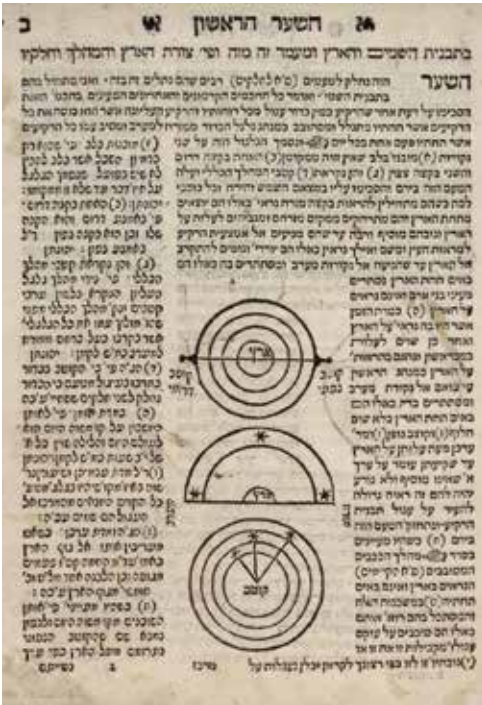
Abraham bar Hiyya. Llibre sobre la forma de la Terra i figura de les esferes celestes , pàgina de l'edició del 1720, Museo Sefardí, Toledo.

El punt àlgid del Call arribà a mitjan segle XIII, quan el rei Jaume I va reconèixer als jueus de Barcelona el dret d'eleger prohoms per administrar justícia dins la comunitat, primer pas vers el seu reconeixement jurídic com a aljama o comunitat amb un govern propi. En aquell mateix moment l'augment de la població jueva a la ciutat va fer necessari crear un nou barri jueu, el Call Menor, fora del recinte de l'antiga muralla romana. Va ser un barri planificat amb una retícula de carrers, que tenia com a centre una sinagoga.