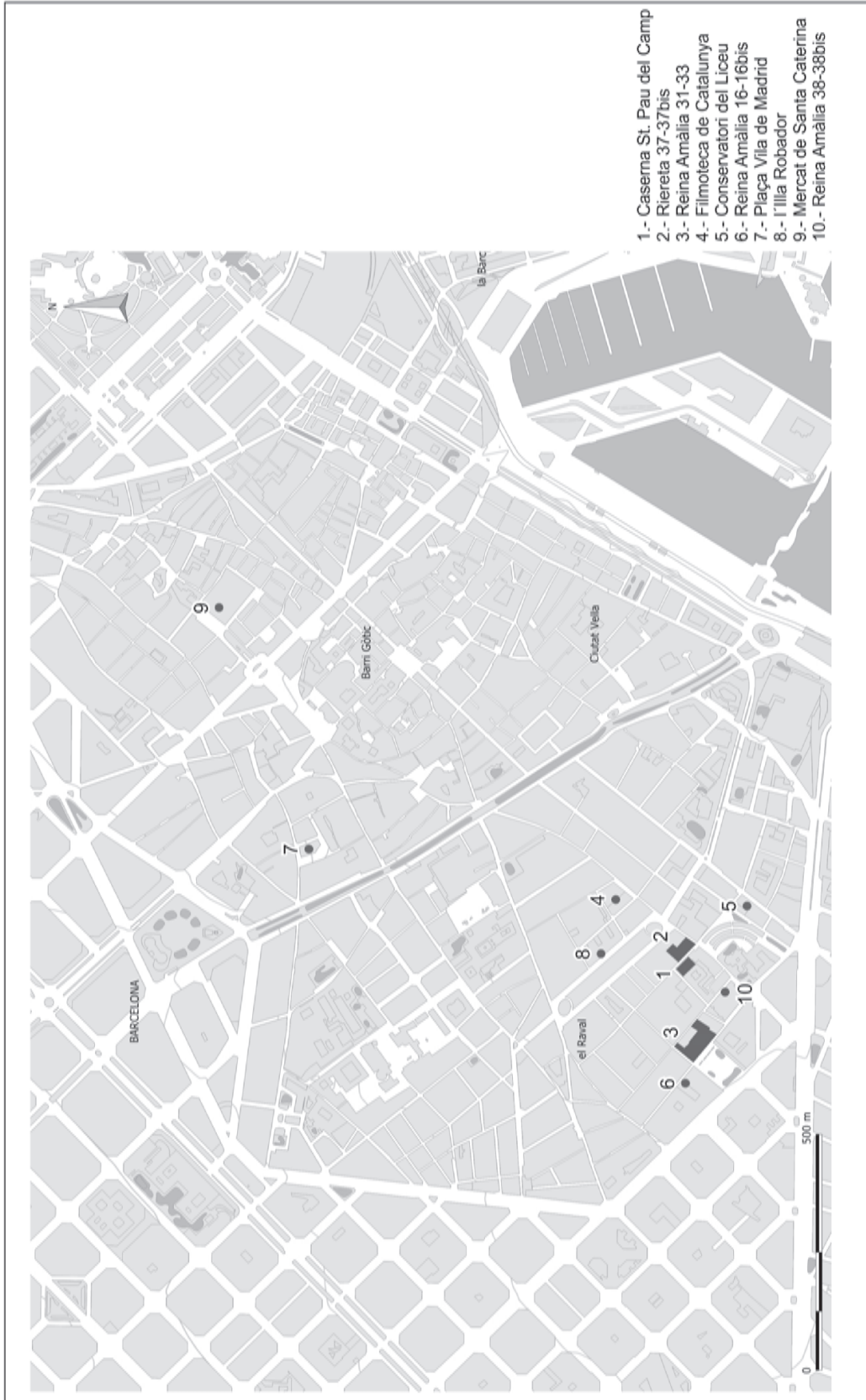
Figura 2 Plànol dels jaciments prehistòrics excavats a Barcelona entre els anys 1990 al 2009. (Planimetria: Oriol Vicente [UAB])