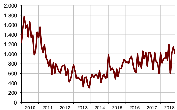
%Taxa variació interanual (2017-2018)