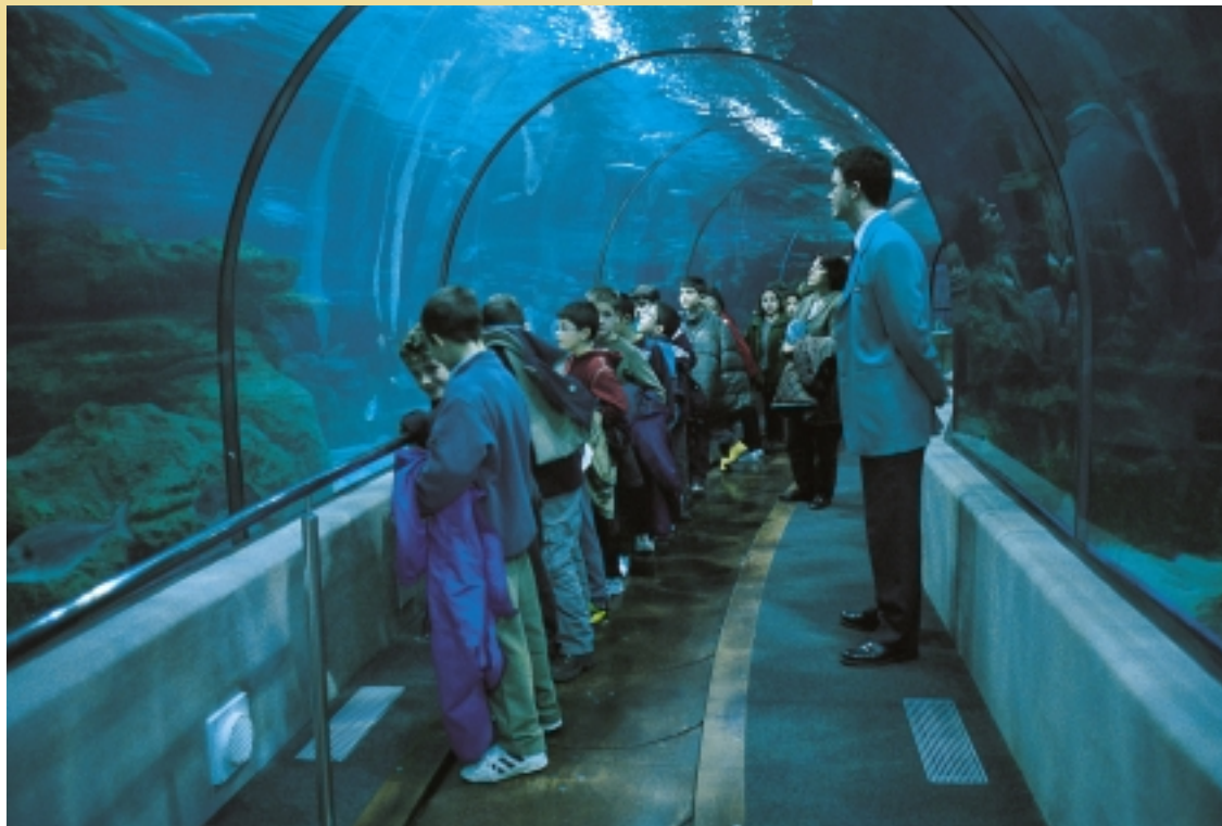
El Consell de Coordinació Pedagògica organitza un conjunt d'activitats de gran importància com a complement de la tasca de l'escola. A la imatge, un grup de nens a l'Aquàrium.

“Cal preveure instàncies educadores i formadores que intervinguin al llarg de tota la vida, però cal, sobretot, formar la població perquè estigui sempre atenta a la pròpia educació i a la pròpia formació, que no sempre han de dependre d'agents externs”.