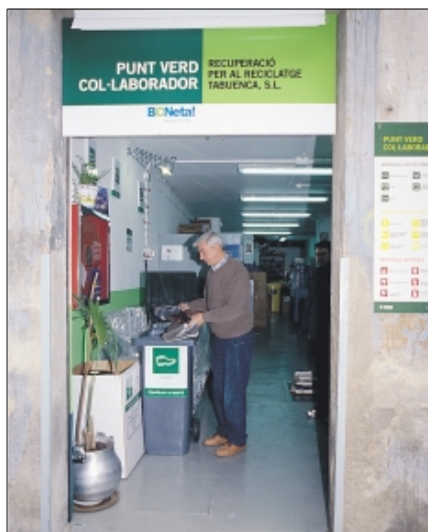
El Punt Verd Col·laborador del carrer de les Guilleries 24, estarà obert de dilluns a divendres, matí i tarda (de 10 a 13'30 i de 16'30 a 19'30), i els dissabtes al matí (de 10 a 13'30).

L'Ajuntament de Barcelona i el Gremi de Recuperació de Catalunya acaben de signar un conveni per integrar els antics drapaires a la xarxa actual de Punts Verds de la ciutat. L'acord s'inicia, precisament, amb un programa pilot al districte de Gràcia: el Punt Verd Col·laborador de l'empresa Tabuenca S.L. al carrer de les Guilleries.