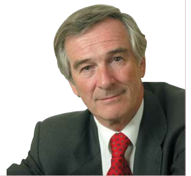
Xavier Trias i Vidal de Llobatera CiU