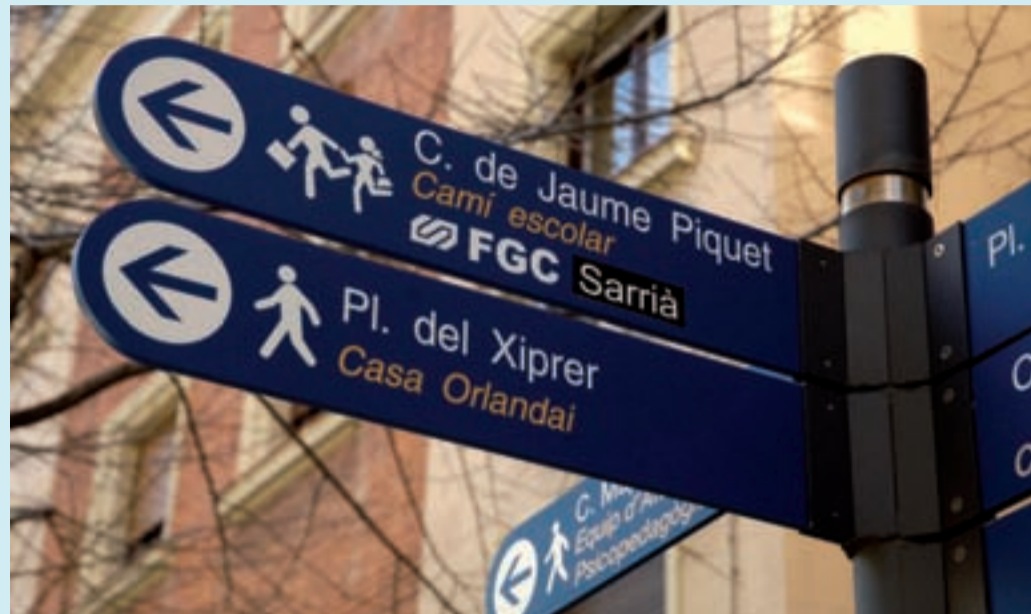
Senyalització d'un camí escolar al barri de Sarrià.