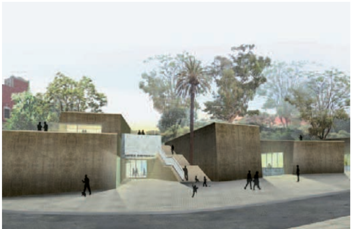
Imatge virtual de la futura biblioteca, amb les instal·lacions soterrades.