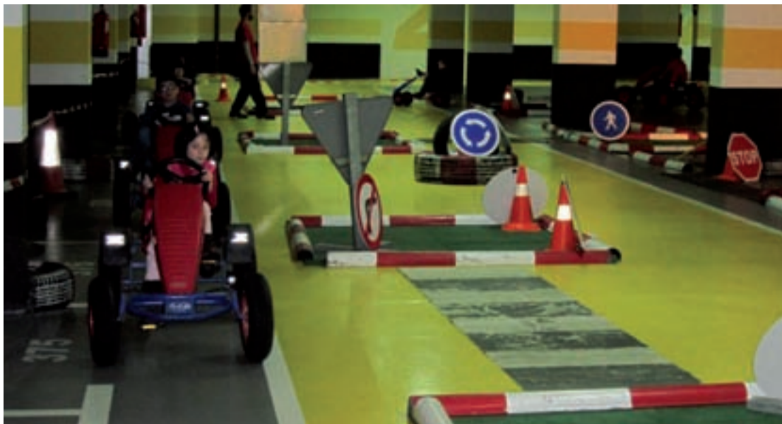
Un circuit de cotxes infantils, durant la inauguració del nou aparcament.