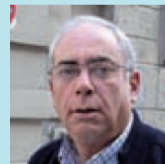
Nacho Codina Comercial

Em sembla bé, tot el que sigui promocionar la cultura al barri és bo. A més, la podran fer servir petits i grans. Actualment, la que ens queda més a prop és la Jaume Fuster.