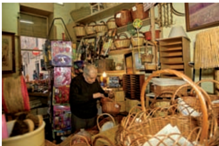
Al barri se'l coneixia com "Ca l'estorer".