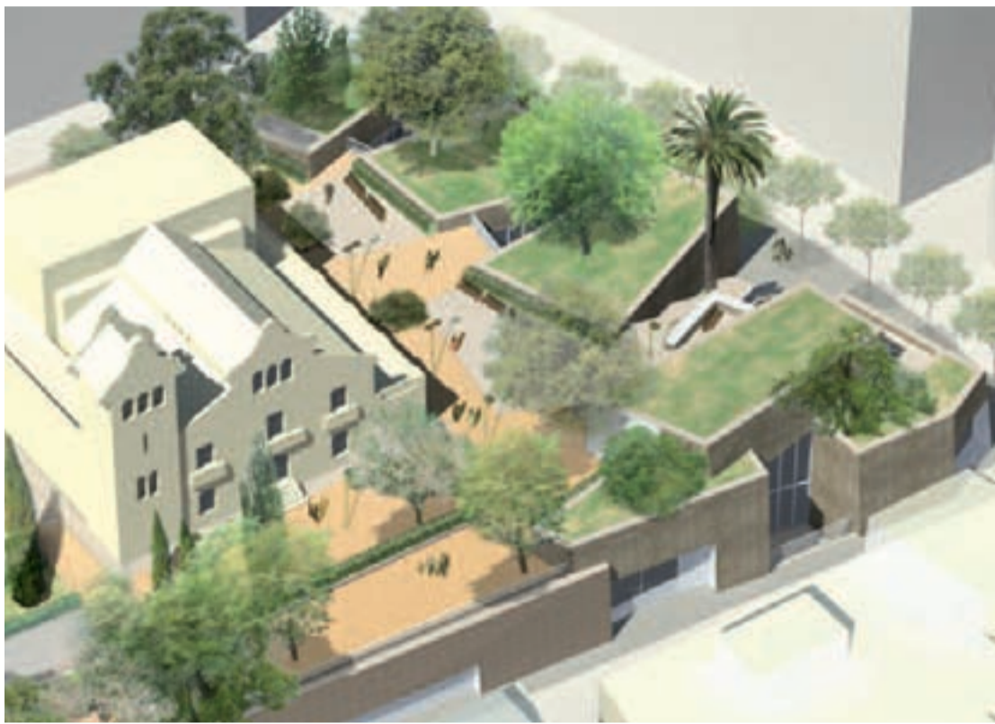
Imatge virtual de la Biblioteca Joan Maragall, on es veu les instal·lacions integrades al jardí.