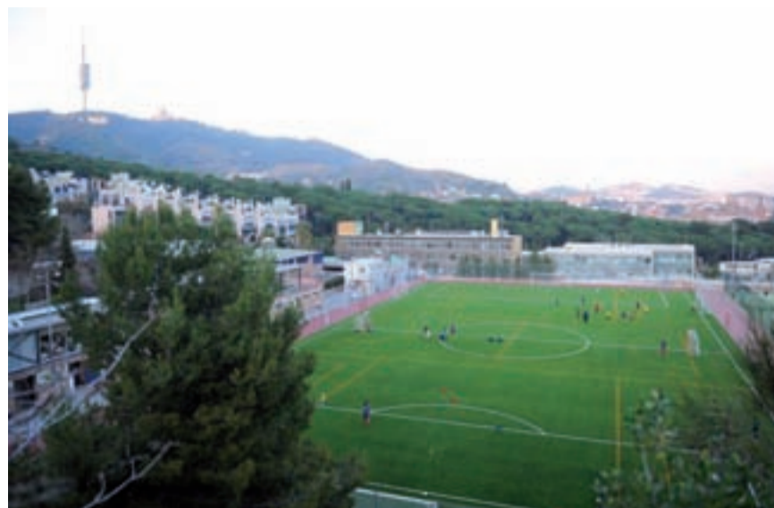
Vista panoràmica del camp de futbol del centre esportiu municipal Can Caralleu.

També s'ha instal·lat un nou sistema de reg d'aspersors i s'ha canviat la base elàstica del camp i la gespa, amb la incorporació del cautxú. Altres novetats són el sistema d'ancoratges de seguretat per a les porteries de futbol sala, la xarxa de protecció perimetral i unes noves porteries. Els usuaris de Can Caralleu, a més a més, veuran millores i reformes en els diferents vestidors de futbol, tant dels jugadors com dels àrbitres, que seran més operatius i confortables. S'hi ha canviat l'enrajolat del terra i les parets i les canalitzacions.