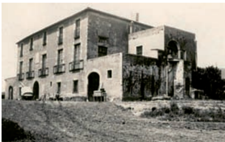
Masia Barral de Sarrià.