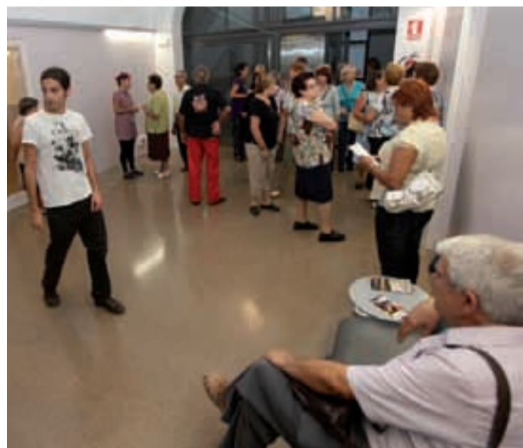
El 29 de setembre s'hi va fer una jornada de portes obertes.

El passat 29 de setembre va tenir lloc una jornada de portes obertes i l'acte de celebració de la reobertura de la Casa del Rellotge. La festa va començar als jardins de Can Ferrero amb l'actuació del grup d'animació Polizon Teatre, el qual va amenitzar la tarda de petits i grans amb les seves acrobàcies. Posteriorment, es van obrir les