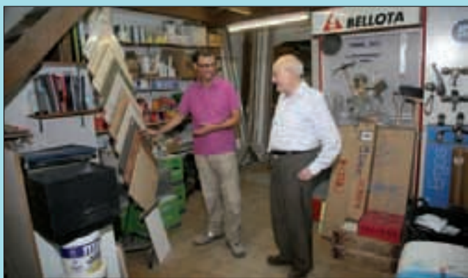
A més de ceràmica, hi ha complements per a la construcció.