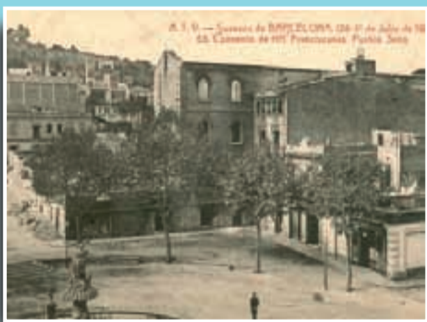
Imatge del convent-escola de les Franciscanes a la plaça del Sortidor, al Poble Sec, després dels fets del mes de juliol de 1909.

Si té fotografies o documents del seu barri, en pot fer donació a l'Arxiu Municipal del Districte, 93 332 47 71