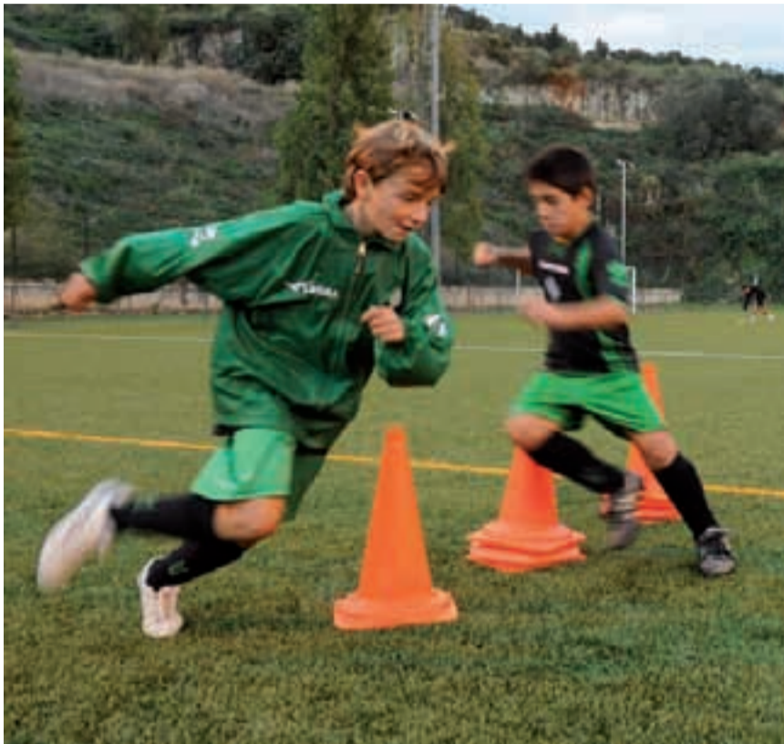
Uns nens s'entrenen al camp.

El terreny de joc del camp de La Bàscula és ocupat cada minut, entre les 17.30 i les 23 h, amb activitats esportives diàries, mentre que els cap de setmana, de 9 h a 18 h, també està a ple rendiment. Per a Bellido,