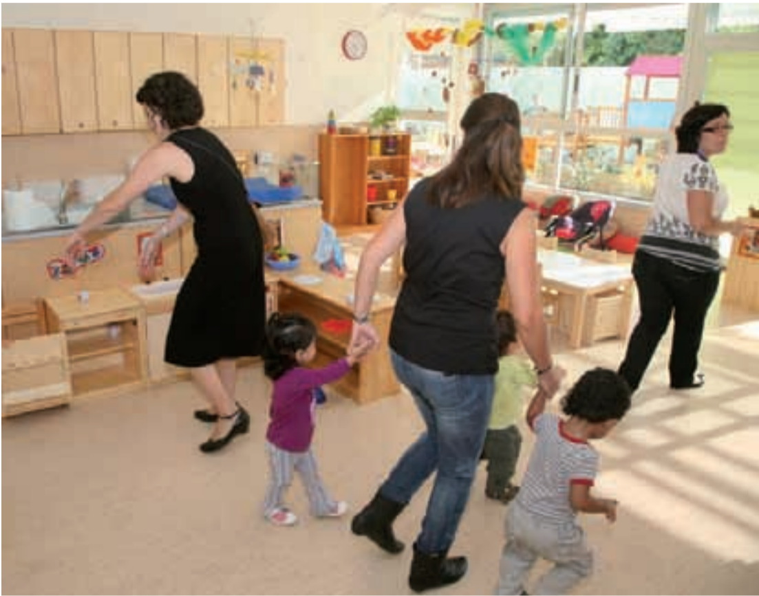
L'escola bressol, el dia de la inauguració.

La renovada escola bressol Collserola ha obert les portes. L'actuació forma part del Pla d'escoles bressol municipals 2007-2011, el qual preveu duplicar l'oferta educativa pública al final de l'actual mandat