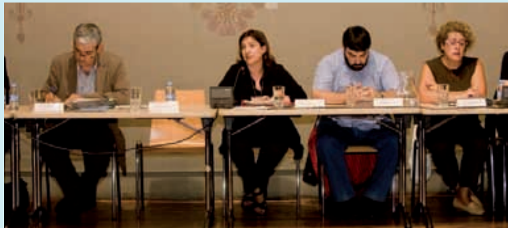
Un moment del Ple del mes d'octubre.