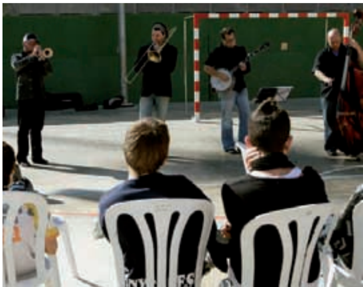
Concert de la Sitjazz Band al pati de l’escola Carles I.

La iniciativa ha rebut el suport de les associacions de mares i pares dels tres centres col·la-