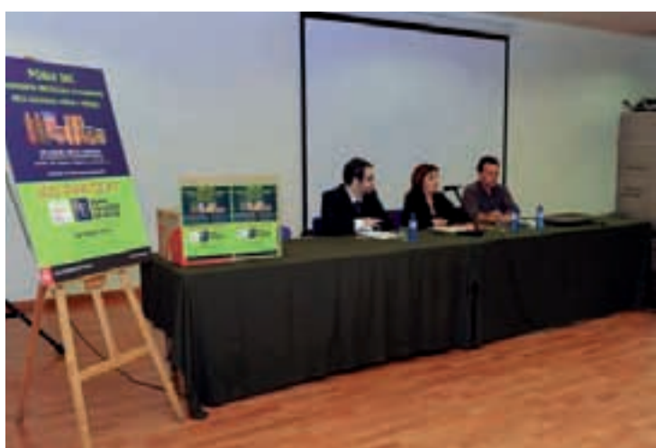
Acte de presentació de la campanya.