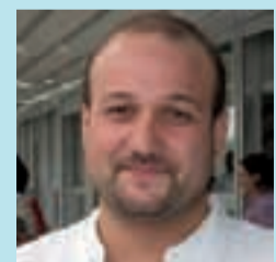
Iván Arizu Informàtic

Me parece una alternativa muy buena a la escuela privada. Aquí el profesorado es muy bueno y, por nuestra experiencia en privadas, preferimos la pública.