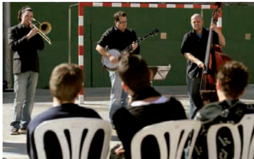
El pati de l'escola Carles I ha acollit activitats com ara aquest concert de jazz.

La Regidoria dels Usos dels Temps treballa en diverses iniciatives per optimitzar l'ús dels patis dels centres escolars fora de l'horari lectiu durant els caps de setmana, de manera que les famílies en puguin fer ús per a activitats lúdiques i culturals. Els patis de les tres escoles de primària del districte que participen en el projecte (La Muntanyeta, Carles I i Mossèn Jacint Verdaguer) ja han començat la seva programació d'activitats, amb propostes com ara tallers infantils, representacions musicals i interpretacions teatrals. Les activitats són gratuïtes i han estat dissenyades especialment per al públic familiar.