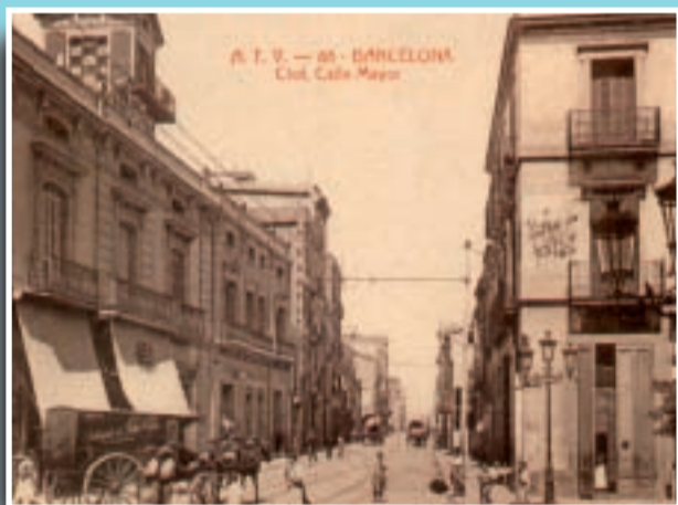
Imatge del carrer del Clot entre 1900 i 1920.

Si té fotografies o documents del seu barri, en pot fer donació a l'Arxiu Municipal del Districte, 93 221 94 44