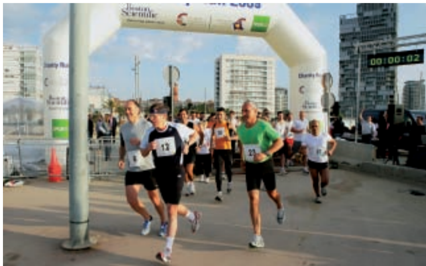
Un moment de la cursa, que es va fer el 20 de maig.

La cursa va tenir un horari molt especial, ja que va fer llevar els organitzadors i tots els participants –uns 70–, molt d'hora, perquè la sortida estava programada a les 7 hores del matí.