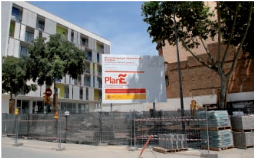
El solar es transformarà en una zona enjardinada.

Gestionada per l'empresa municipal Bagursa, la idea és que l'obra estigui acabada després de l'estiu, dins del termini que va marcar el govern espanyol per acabar els projectes finançats per aquest fons.