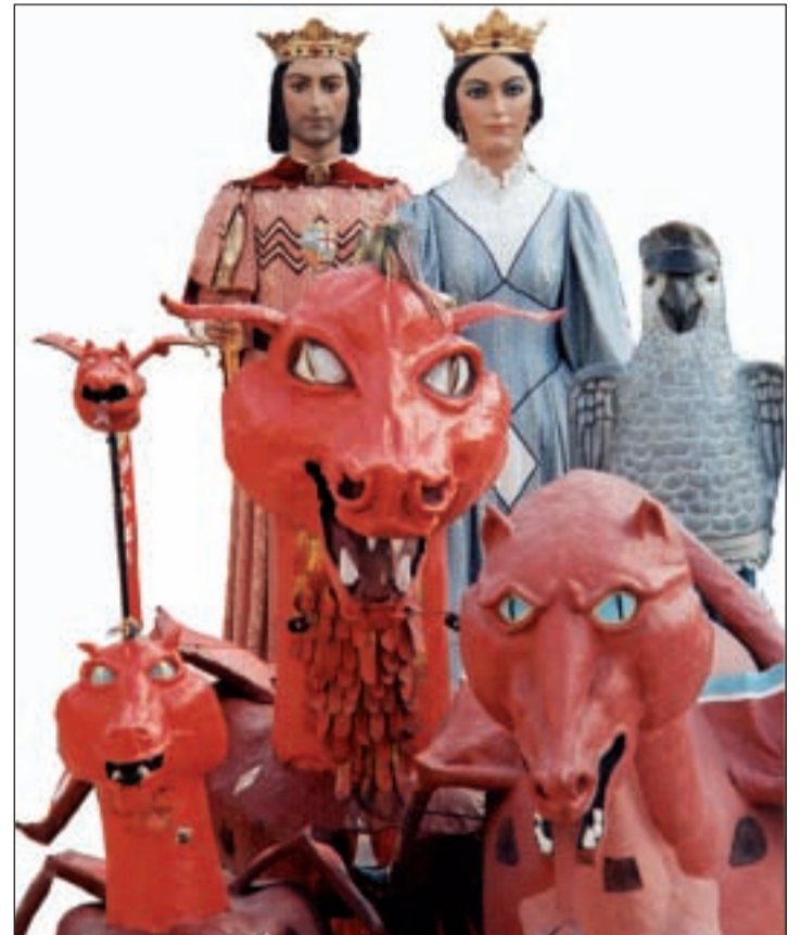
Figures d'imatgeria festiva que es poden veure al nou centre.

Sant Martí –el primer d'aquestes característiques que hi ha a Barcelona– és una iniciativa de la Colla del Drac del Poblenou i de la Colla dels Gegants del Poblenou, dues entitats que treballen en aquest projecte des del 1997. El centre s'ha instal·lat a la planta