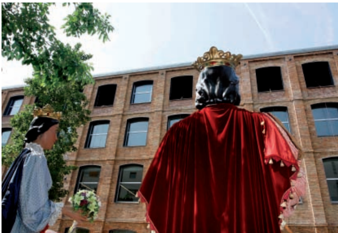
Els gegants del Poblenou, davant de Can Saladrigas el dia de la inauguració.

Una festa popular, amb la participació dels gegants i el drac del Poblenou, va servir per donar la benvinguda, el passat 10 de maig, al nou equipament, el qual ha requerit una inversió de 5,5 milions d'euros al barri