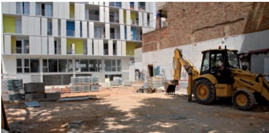
L'espai es convertirà en un jardí i una zona d'esbarjo.