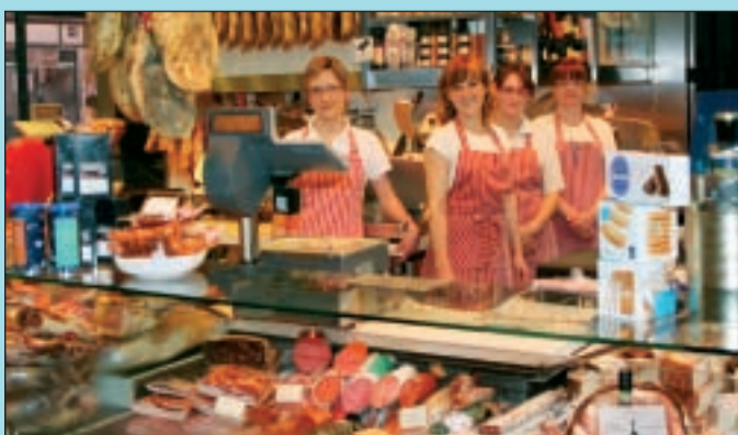
Una de les grans especialitats són les botifarres.