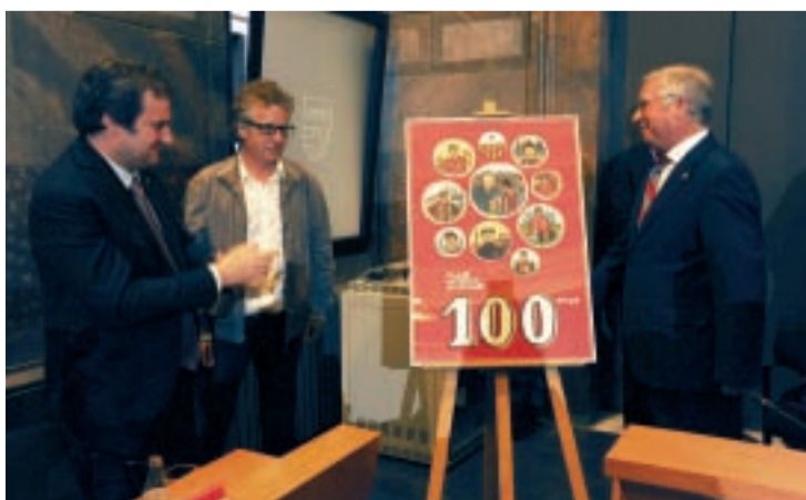
Presentació del cartell del centenari.