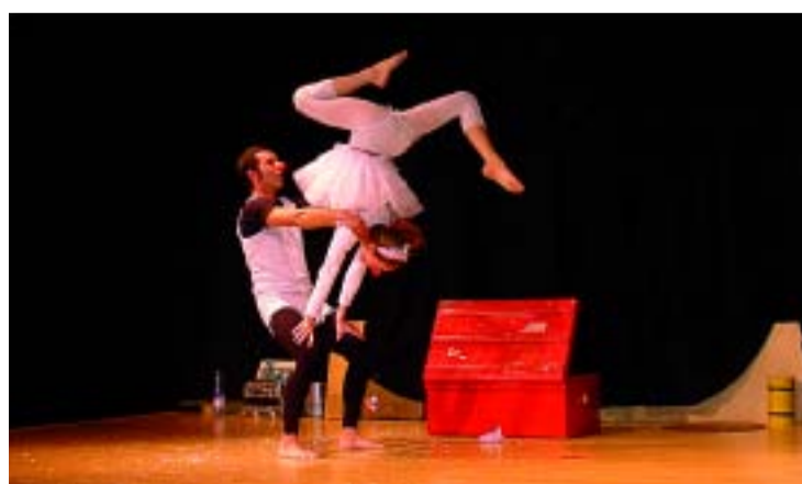
La setmana inclou actes més polítics i també de culturals.