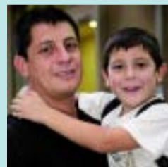
Hugo Martín Hoteleria

Sí que ho sé i em sembla molt bé perquè sempre fan falta escoles bressol. Hi ha molts nens al barri.