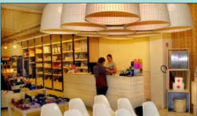
Cada racó de la botiga és un món de sensacions.

La nostra llar ha de ser cada cop més un refugi físic i emocional on ens sentim bé i on puguem tenir cura de cos, ment i ànima. Aquesta és la filosofia de Be House, un establiment que ha nascut amb la intenció d'ajudar a fer que casa nostra esdevingui el nostre millor entorn i una projecció de la nostra manera de ser. A Be House, hi trobarem productes per sentir, cuinar, olorar, ballar, descansar i cuidar-se. És un espai càlid, urbà i cada racó de la botiga és un món de sensacions, amb propostes