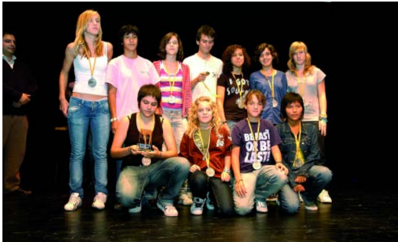
En un acte paral·lel, celebrat a la tarda, la Nit de l'Esport també reconeix els esportistes més joves.