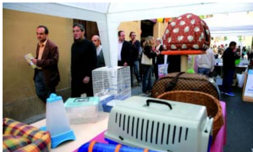
La festa del comerç es va celebrar el 4 d'octubre.

Cinc espais públics del districte van ser ocupats per les parades de les botigues que van voler acostar, encara més, la seva oferta comercial al veïnat. El dissabte 4 d'octubre Gràcia va celebrar, un cop més, la festa del Comerç al carrer. Amb aquest motiu, espais que normalment són ocupats per cotxes i motos van omplir-se de vianants, que podien tafanejar, passejar, triar, remenar i comprar tota mena d'articles. Hi va haver parades comercials a la travessera de Gràcia (entre el carrer Gran i el torrent de l'Olla), els carrers Verdi (entre el carrer Or i plaça Revolució), Astúries (el carrer Gran i torrent de l'Olla) i les places Virreina, Lesseps i Joaníc.