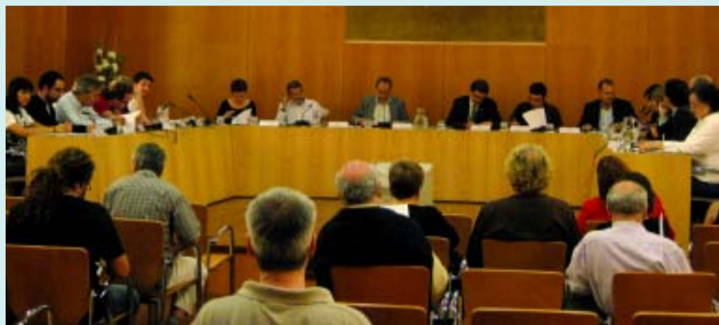
Un moment de la celebració del Ple del dia 30 de setembre.