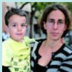
Carlota Bernat Informàtica

No ho sabia i em sembla bé. Tenim uns amics que acaben de tenir un nen i veiem que és un problema trobar escola. Com més n'hi hagi, millor.