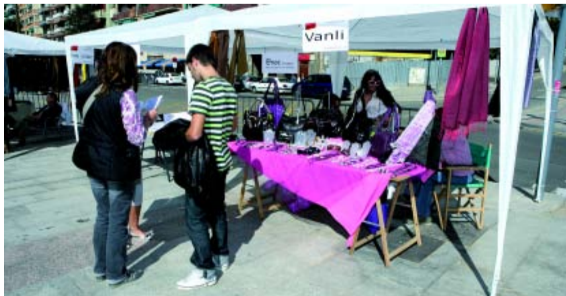
La festa del comerç s'ha celebrat a tot el districte, amb la participació de botigues de totes les especialitats.

Entre les activitats que van organitzar les associacions de comerciants al llarg del dia hi va haver xocolatades, un taller de circ i activitats per a infants. Els Mossos d'Esquadra també hi van col·laborar amb diverses activitats per a nens i nenes.