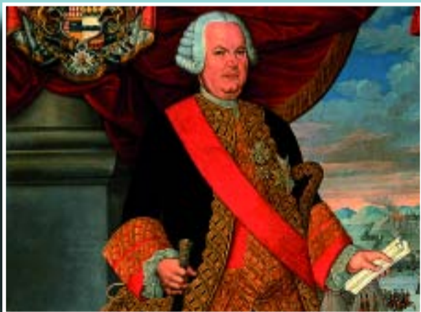
El virrei Amat.

Si té fotografies o documents del seu barri, en pot fer donació a l'Arxiu Municipal del Districte, 93 368 45 66