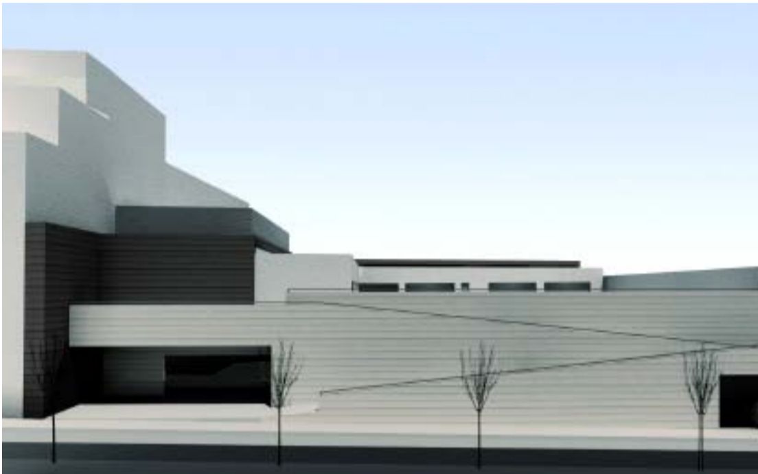
Imatge virtual de l'edifici de la futura escola bressol.

Gràcia tindrà una nova escola bressol al carrer Neptú. El projecte forma part del Pla d'escoles bressol municipals 2007-2011 i preveu també la construcció d'una pista poliesportiva i d'un aparcament