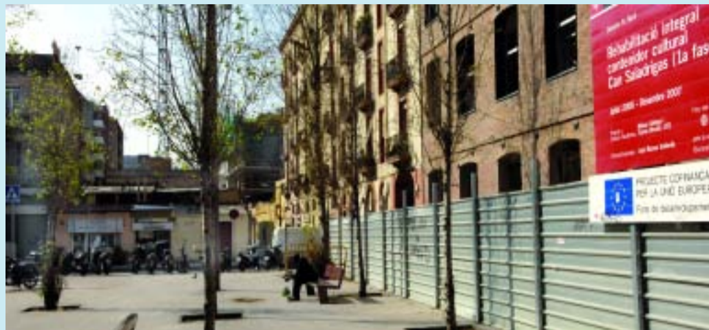
El carrer Ramon Turró, des del carrer Castanys.