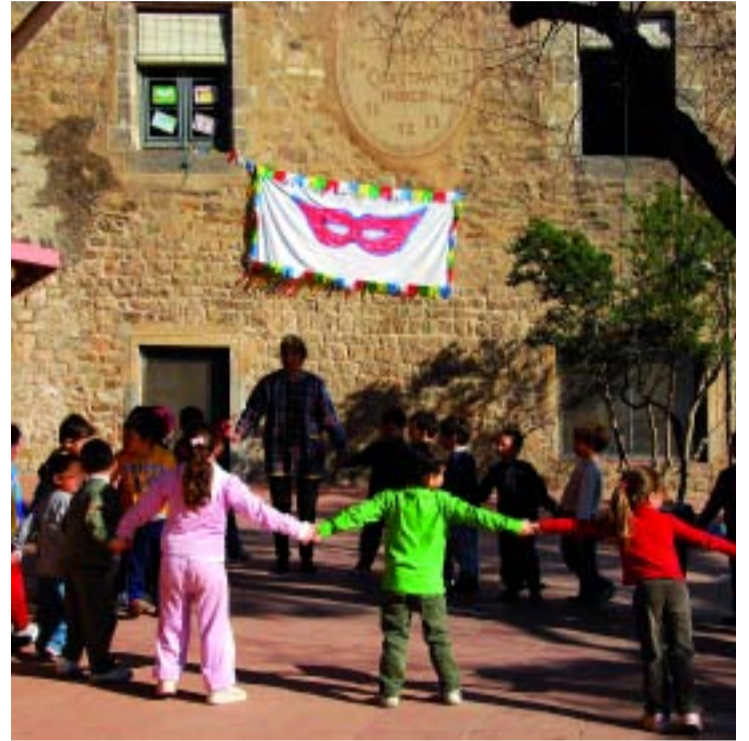
Alumnes de l'escola Casas al pati de l'històric edifici.

Des de llavors han estat més de 75 anys d'activitat docent pràcticament ininterrompuda. Les fotos de l'època deixen constància de la formació integral –acadèmica i domèstica– que rebien les noies obreres, on hi havia lloc per a la planxa i per a la dansa. L'escola no va ser mixta fins als anys 80.