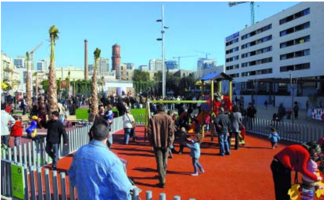
Els nous jardins, situats entre Bac de Roda i Pellaires.

El Poblenou estrena dos nous jardins, el primer situat a la confluència dels carrers de Bac de Roda i Pellaires i el segon, que durà el nom de Teresa de Calcuta, al Camí Antic de València entre els carrers de Bilbao i Espronceda