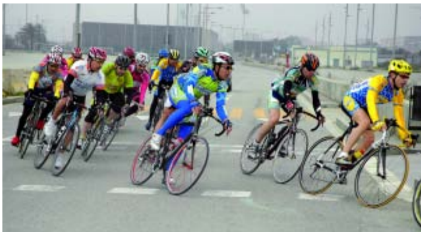
La cursa dona 25 voltes a un circuit de 1.800 metres.

El recorregut consistia a fer 25 voltes a un circuit urbà de 1.800 metres si-