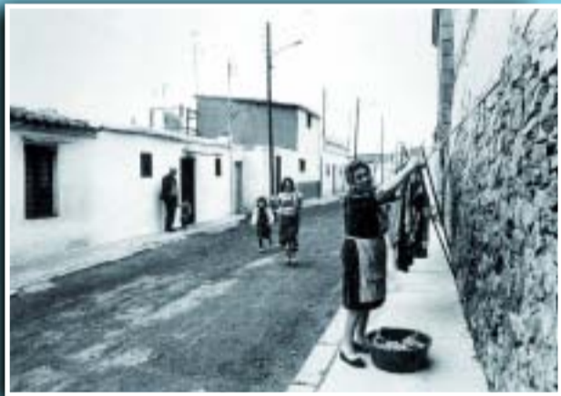
Un dels carrers del barri de rere el cementiri, l'any 1976.

Si té fotografies o documents del seu barri, en pot fer donació a l'Arxiu Municipal del Districte, 93 221 94 44