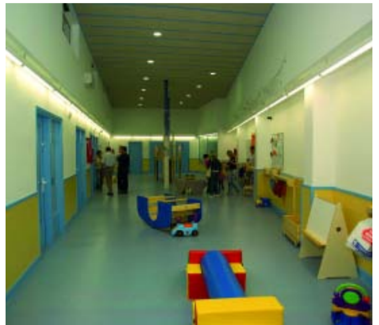
Les famílies poden visitar les escoles per conèixer millor els centres.

Cada escola tria unes dates per a les portes obertes. I n'hi ha algunes que ja les han fet