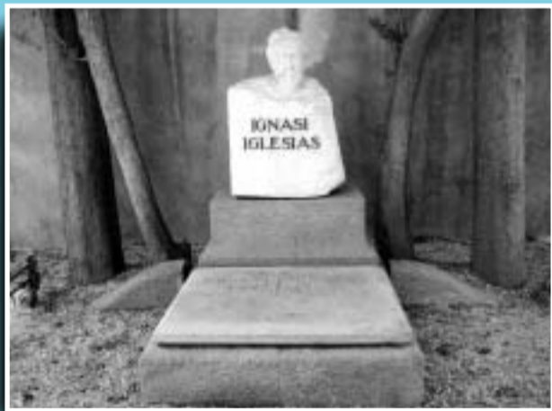
La tomba del dramaturg andreuenc Ignasi Iglésias (1871-1928).

Si té fotografies o documents del seu barri, en pot fer donació l'Arxiu Municipal del Districte, 93 291 68 36