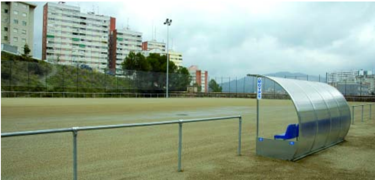
El nou camp de futbol provisional de Ciutat Meridiana.