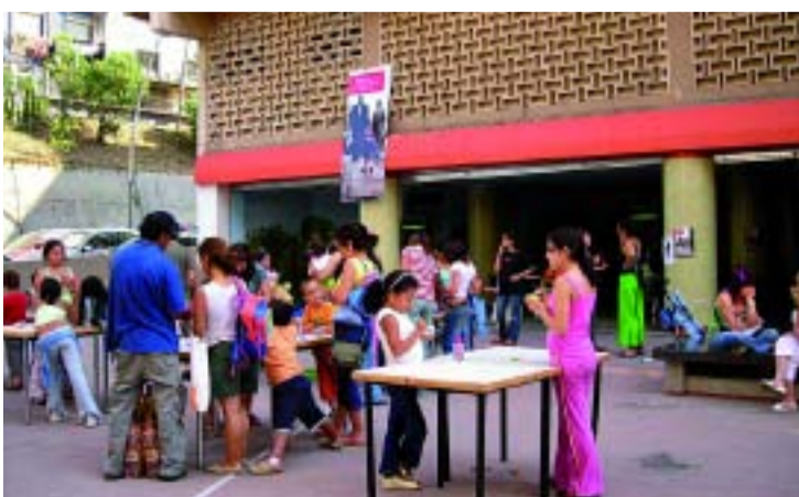
Taller d'una edició anterior del festival.