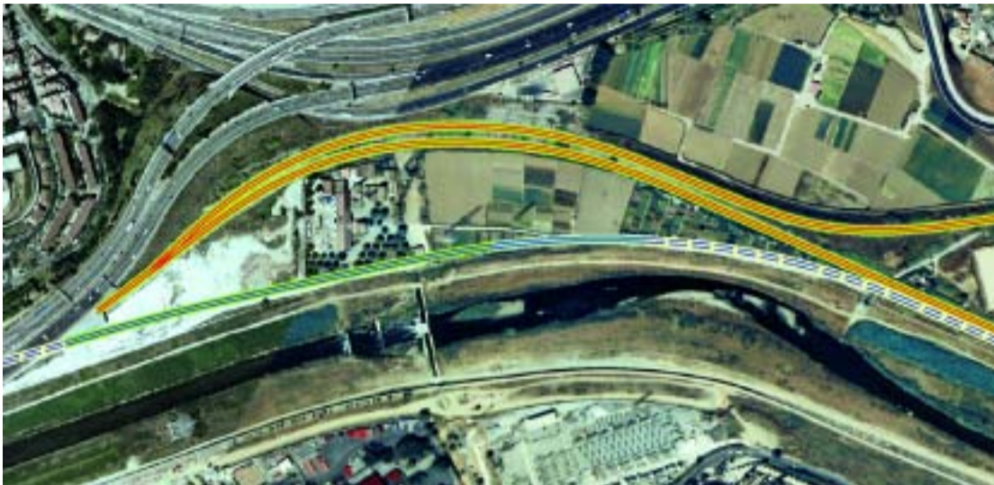
Imatge virtual del traçat que seguirà l'AVE.