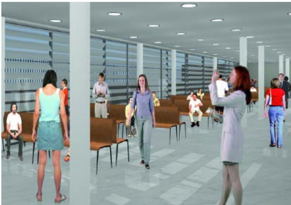
Imatge virtual de l'interior del complex socio-sanitari.

La Generalitat aprova una partida de prop de 350 milions d'euros per al complex, el qual es començarà a construir durant el primer semestre de 2008 i inclourà diversos centres de salut