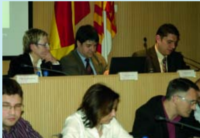
Un moment de la celebració de l'últim Ple del Districte.