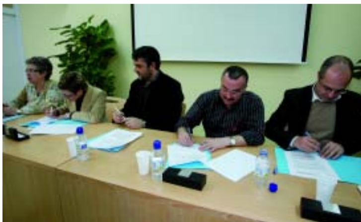
Moment de la signatura del conveni.