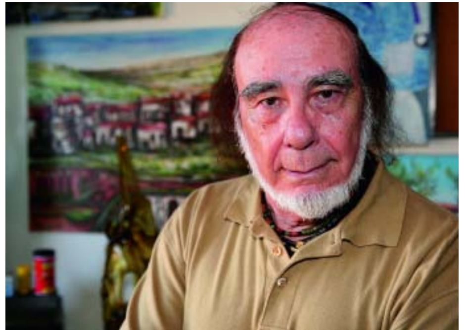
Atienza té una extensa obra repartida entre Espanya i Amèrica Llatina.

En un dels viatges que vaig fer amb el Madrid a Brussel·les, va haver-hi uns murals i vitralls per a l'Exposició Universal que em van arribar al cor. Vaig quedar com il·luminat i a la tornada se'm va posar al cap que jo havia de fer vitralls. No trobava vidre i per fer el que jo volia fer, amb vidre i ciment, vaig crear una fàbrica de vidre de colors. Era un ofici que s'havia perdut. Vaig deixar-ho tot per fer vidre i em