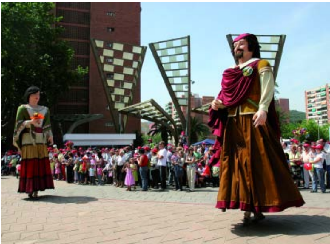
Els gegants, durant la Festa Major de l'any passat.

El grup de pop mallorquí Antònia Font i el popular còmic són les estrelles destacades d'una festa que aposta pels espectacles de cultura popular com els castellers, els diables i les cercaviles