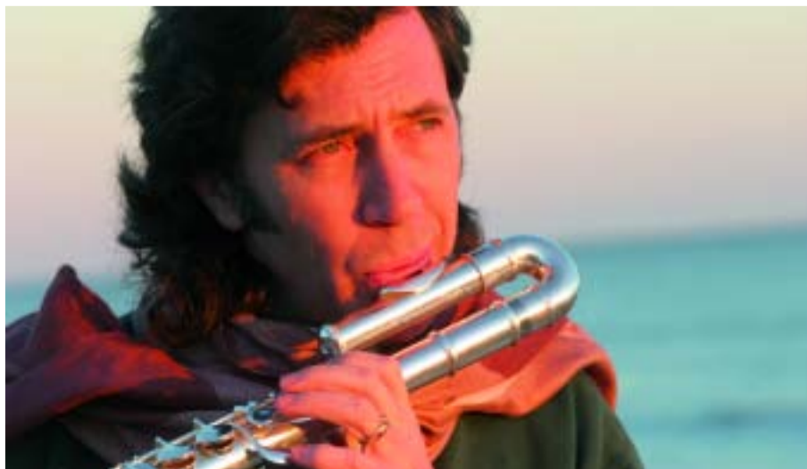
Jorge Pardo està considerat un dels principals artífexs del flamenc jazz.