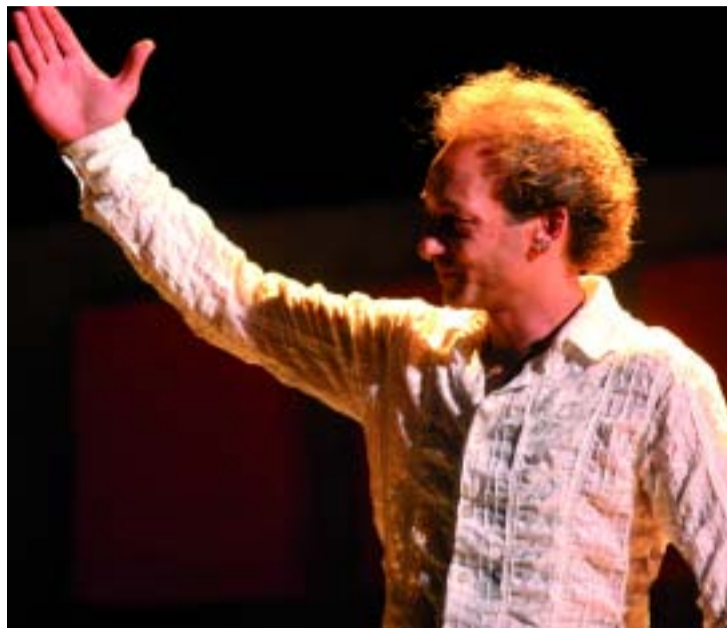
El cantaor Juan Cortés, més conegut com a "Duquende".

Un any més, la primavera arriba acompanyada de ritmes flamencs. I no només això: som a les portes del Festival de Flamenc de Nou Barris, una de les celebracions d'aquest gènere més destacades de Barcelona i de tot Catalunya: tres dies en què el nom del districte ressonarà en la ment, el cor i les converses de tots aquells aficionats i seguidors d'un gènere musical, una cultura i un sentiment molt estesos a Catalunya i al conjunt de l'Estat. El Festival de Flamenc de Nou Barris és, des de fa nou anys, un digne altaveu que aglutina tant les propostes més puristes com les més innovadores del gènere, ja que procura mostrar les diferents possibilitats artístiques d'aquest estil ("cante", "baile" i "toque"), en un escenari ple de màgia (el pati de la seu del Districte de Nou Barris, al carrer Dr. Pi i Molist, 133, a les 21.30 hores) i a uns preus molt assequibles. Enguany, les actuacions tornen a repartir-se en tres nits. Així, dijous 15 de maig actuarà