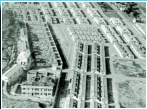
Construcció de les cases barates de Can Peguera el 1929.

Si té fotografies o documents del seu barri, en pot fer donació a l'Arxiu Municipal del Districte, 93 291 68 36