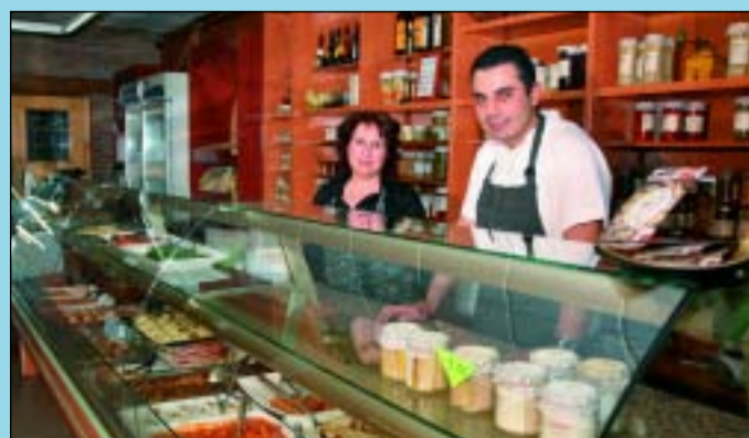
Ofereixen menús econòmics de dilluns a divendres.

Hi ha molta gent que agraeix tenir algú que els faci el menjar: aquells que no tenen temps de cuinar, els que no en tenen ganes, els que no hi tenen prou traça o els que volen dedicar el seu temps a altres coses. La Botigueta del Bon Menjar és un establiment que els ho posa ben fàcil. Venen plats cuinats, fets per ells mateixos de forma casolana. De dimarts a divendres tenen un menú on podem triar primer plat, segon i postre a preu econòmic. Els caps de setmana les possibilitats d'elecció són encara