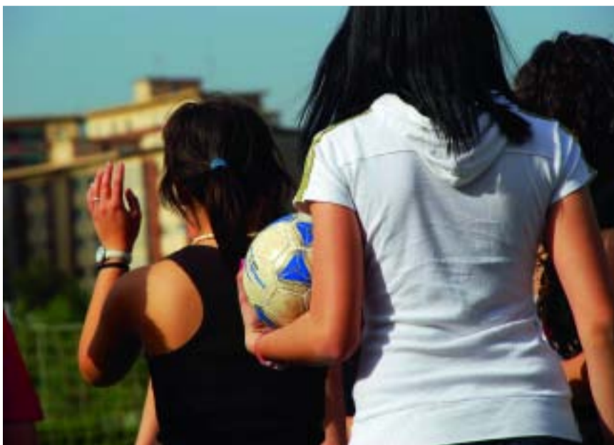
El programa està adreçat als alumnes de 3r i 4t d’ESO.

tuites, estaven destinades, primer, a descobrir als alumnes què s’ofereix en un centre esportiu i, segon, la seva participació en xerrades-tallers de prevenció de la drogodependència.