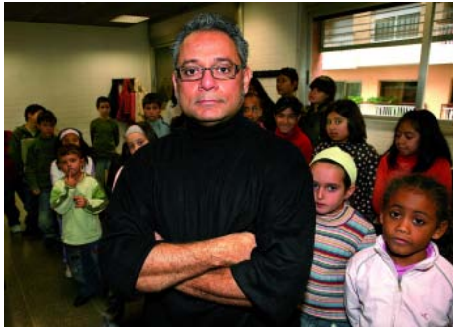
Un dels seus projectes és la dinamització de la música iberoamericana arreu d'Europa.

Nosaltres diem que hi ha una espècie de trilogia. Una és la formació en si