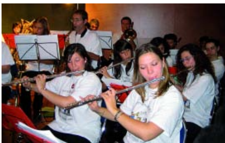
55 músics de l'orquestra de vent van participar al concert.