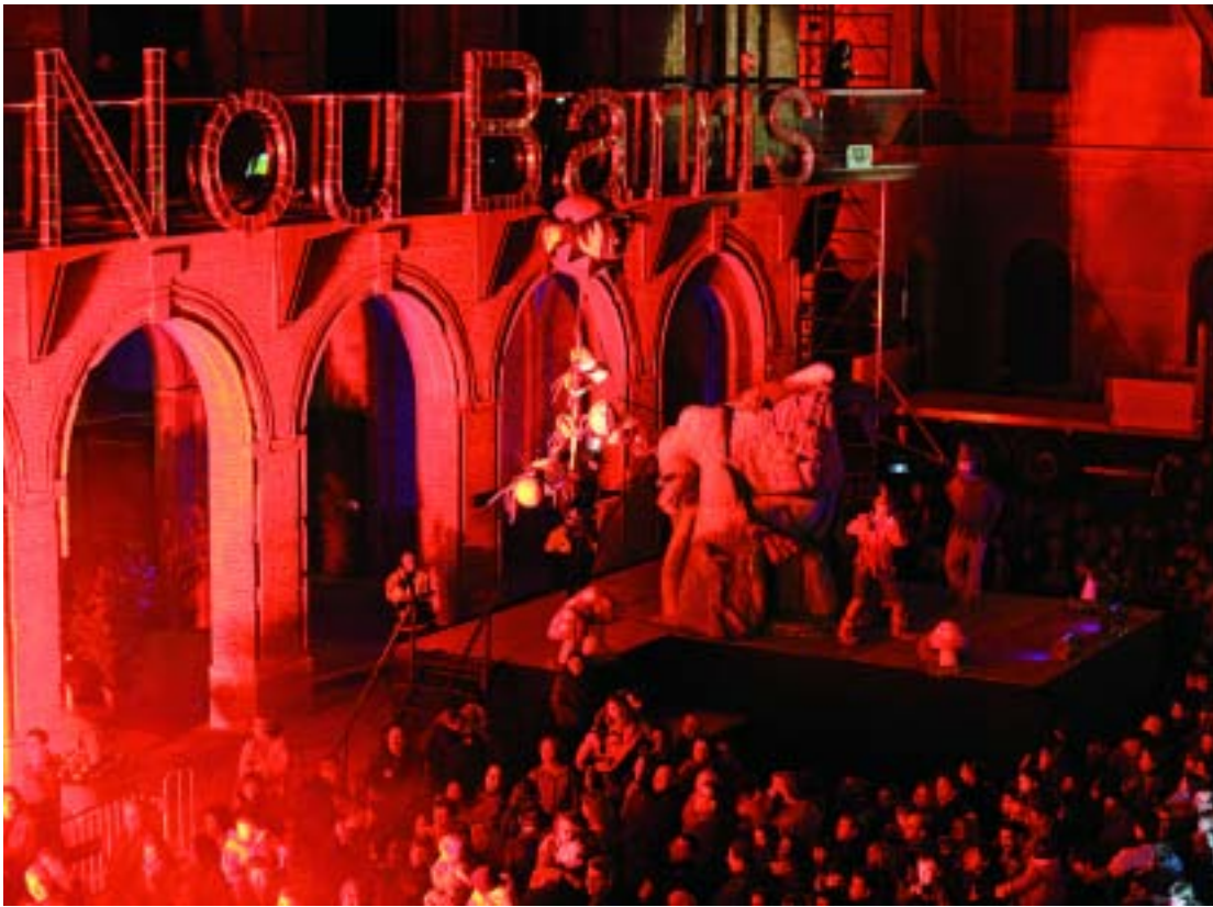
Com tots els anys, els Reis seran rebuts a la plaça Major de Nou Barris.