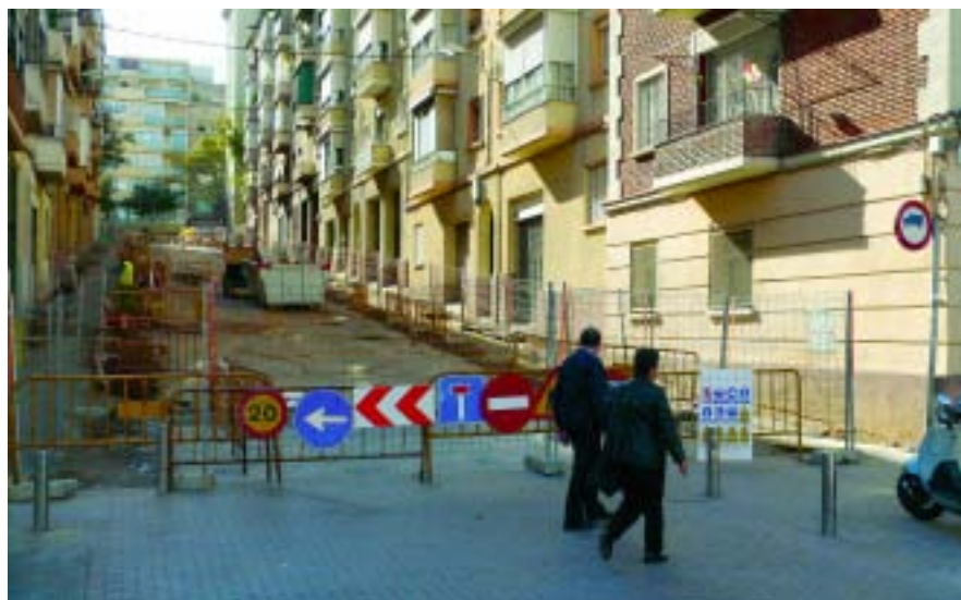
El carrer Pontons, que tindrà només un carril de circulació per a vehicles.

La millora de l'espai públic continua sent una de les prioritats del programa d'actuació del Districte. Dins d'aquest context, s'emmarquen les obres de remodelació integral dels carrers Pontons i Vèlia, aquest últim en el tram comprès entre Escòcia i Riera d'Horta. Amb les obres se suprimiran nombroses barreres arquitectòniques, s'ampliarà la superfície per a vianants, es renovarà completament el mobiliari urbà, es plantarà nou arbrat i es renovaran les xarxes d'infraestructures de serveis, entre altres actuacions de millora. Pontons tindrà plataforma única i, per tant donarà prioritat als vianants.