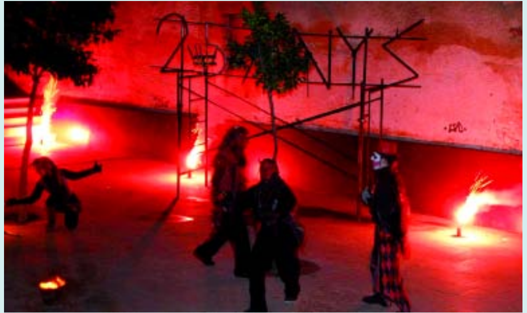
Un dels espectacles de carrer amb què es va celebrar l'aniversari el passat mes de novembre.