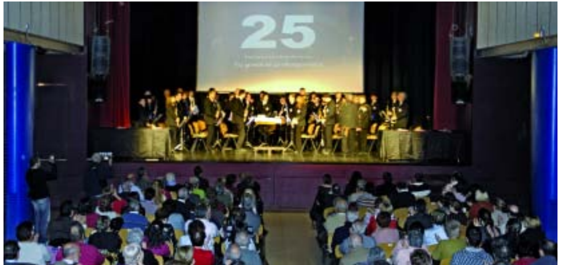
Un moment de la celebració de l'aniversari de l'entitat.

L'Arxiu Històric de Roquetes-Nou Barris acull nombrosos documents que formen part de la memòria col·lectiva. Aquest 2008 ha complert 25 anys