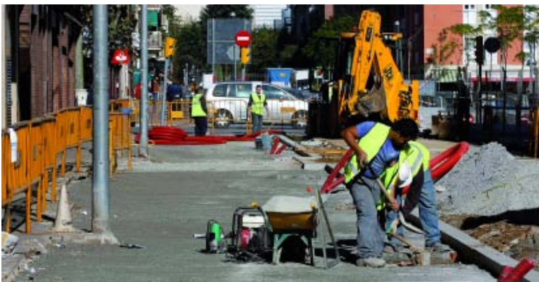
Obres de millora del carrer Vèlia.

Les obres preveuen la nova pavimentació de l'espai, l'adequació de la xarxa de sanejament, una nova xarxa d'enllumenat públic, el soterrament de les xarxes de serveis aeris existents, com també nova plantació d'arbrat i nou mobiliari urbà. Una altra característica de la intervenció és la supressió de les barres arquitectòniques.