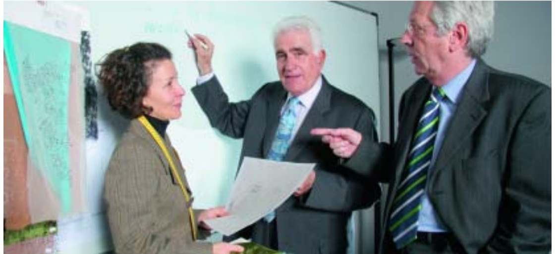
Els veterans ajuden els joves a muntar nous negocis empresarials.