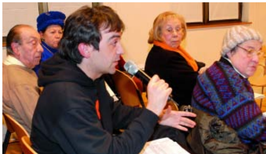
Els ciutadans podran participar-hi mitjançant diversos canals.

El Programa d'Actuació del Districte és el document on es recullen tots els projectes que el Districte preveu tirar endavant durant els quatre anys que dura el mandat municipal. El Districte d'Horta-Guinardó ja té una proposta de Programa d'Actuació que vol posar en coneixement de tothom, perquè qui vulgui pugui dir-hi la seva. Aquesta revista fa una síntesi d'aquest document (pàgines 3 i 4), el qual es pot consultar íntegrament al web www.bcn.cat/horta-guinardó . Aquest document és la base sobre la qual s'endega un procés de participació obert a tothom amb l'objectiu de conèixer l'opinió de les persones que viuen al districte. La recollida de propostes s'allarga fins al dia 8 de novembre.