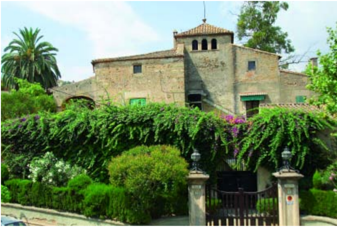
Es preveu que Can Fargas pugui ser equipament públic durant aquest mandat.

La proposta del Programa d'Actuació que el Districte es proposa dur a terme els propers quatre anys gira al voltant de quatre eixos: l'urbanisme, els equipaments, els serveis a les persones i l'espai públic