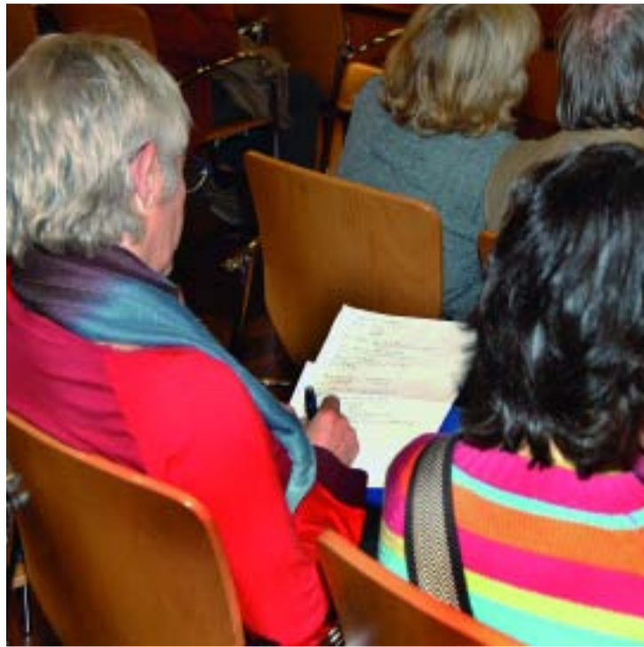
La participació de tothom és molt important.