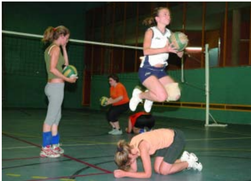
La secció femenina del club, durant un entrenament.