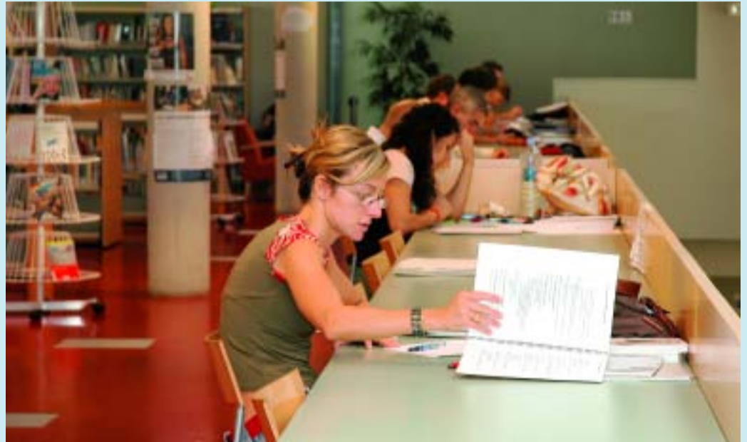
La Biblioteca Mercè Rodoreda, al Guinardó.

La prestació de serveis a les persones és un dels quatre àmbits d'actuació amb més pes dintre els projectes per a aquests quatre anys