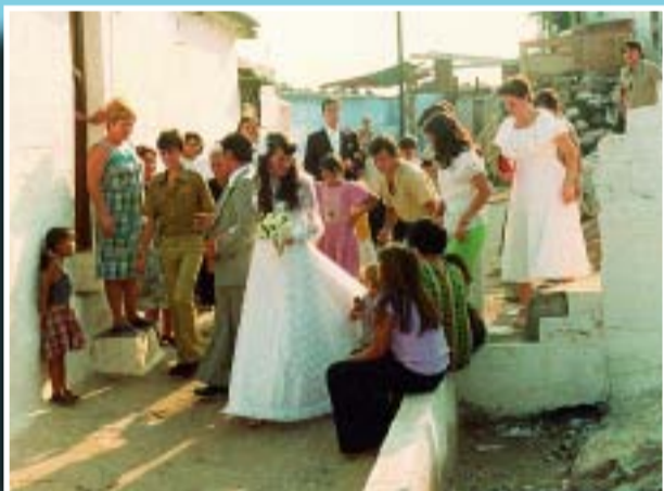
Casament a les barraques del cim del turó de la Rovira, l'estiu de 1978.

Si té fotografies o documents del seu barri, en pot fer donació a l'Arxiu Municipal del Districte, 93 291 67 26