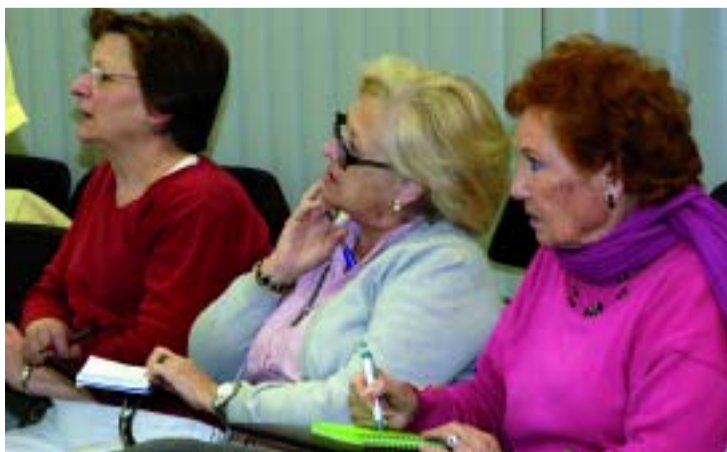
La gent gran pot ampliar coneixements a les Aules.