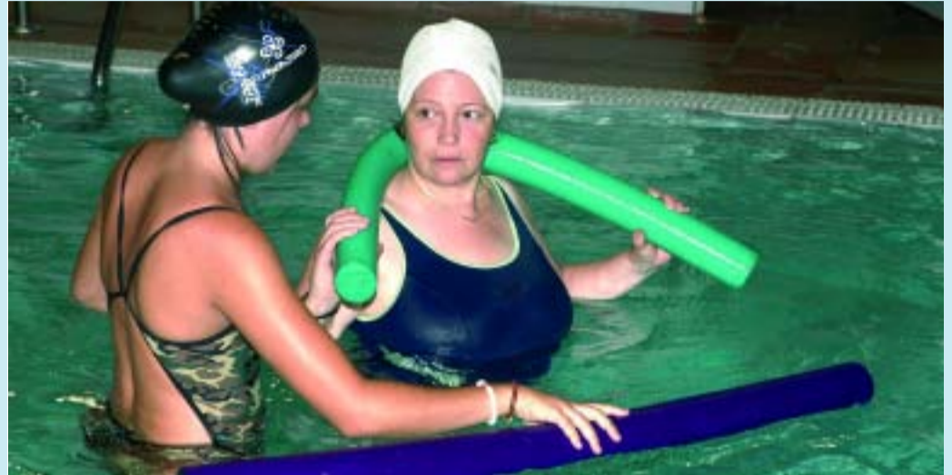
Sessió d'aquagym especial per als socis d'Afibrocat.