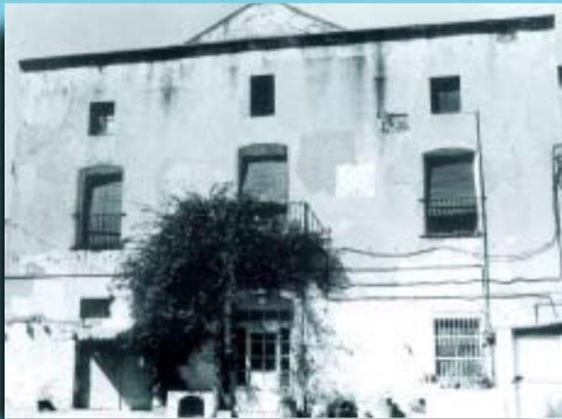
La masia de can Carreres l'any 1990.

Si té fotografies o documents del seu barri, en pot fer donació a l'Arxiu Municipal del Districte, 93 291 67 26