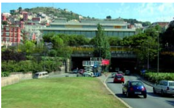
Abans de l'estiu de 2008 també estrenarà nova pavimentació.