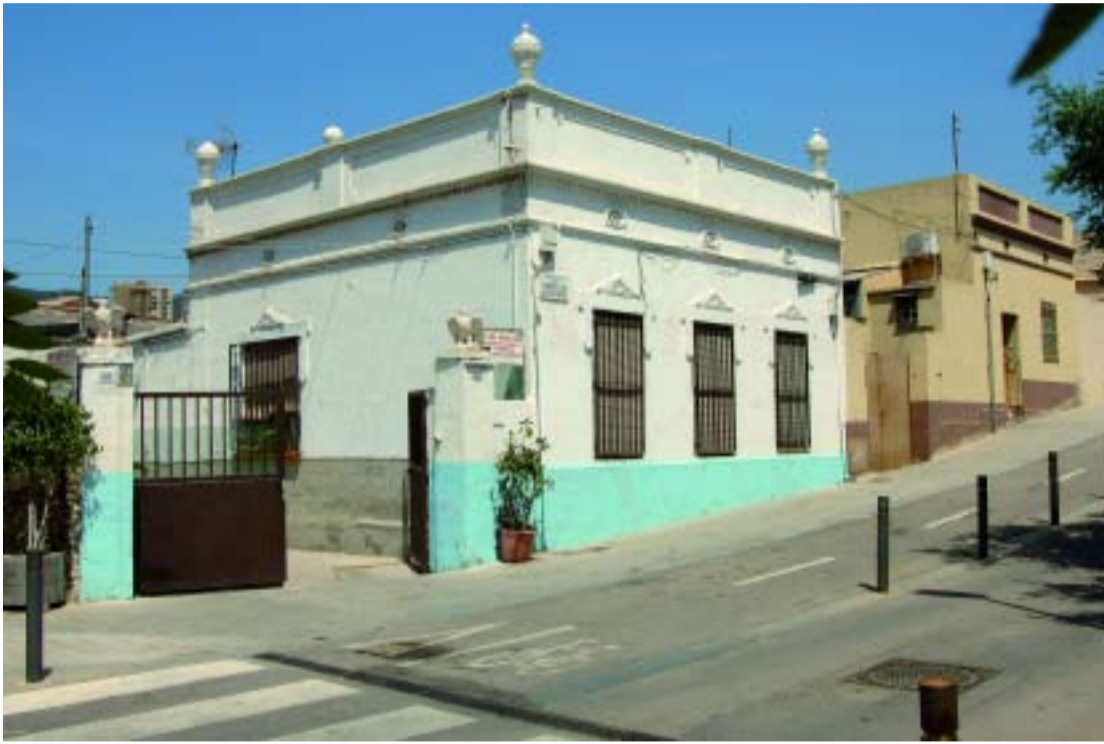
El barri de la Clota conserva una estructura de caràcter semirural.

Els barris de la Taxonera i la Clota seran els protagonistes d'una transformació urbanística i social, quan a partir de l'any vinent es comencin a desenvolupar els plans de millora urbana