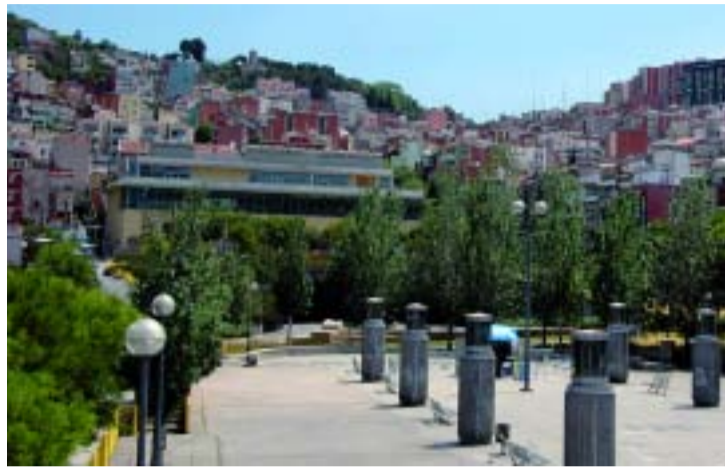
El Carmel guanyarà nous espais públics.

L'Ajuntament revisa el planejament urbanístic del barri amb l'objectiu d'adaptar els projectes previstos a les necessitats reals del barri