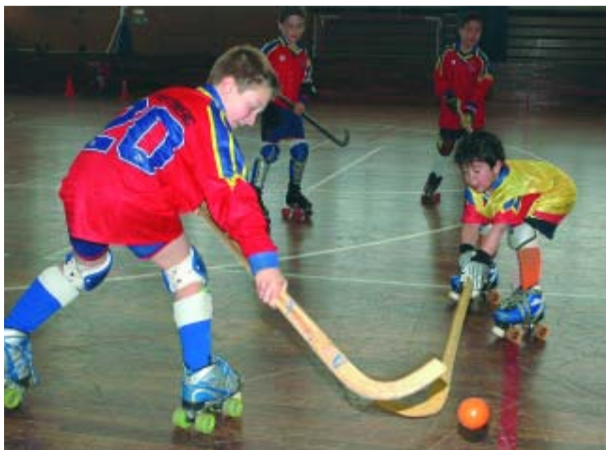
Nens de l'equip de benjamins d'hoquei patins del Martinenc.

Per al gerent del FC Martinenc, "la bona relació entre el barri i la institució fa que tothom ens estimi i que el club actuï com a complement de les necessitats del seu entorn".