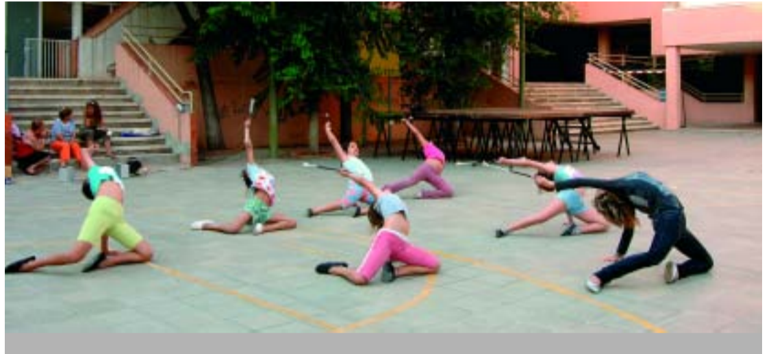
Un grup assaja al pati de l'antiga escola.

L'antiga escola Pirineu cobreix una necessitat social al barri de Can Baró, ja que a la seva funció d'hotel d'escoles, hi afegeix la de casal