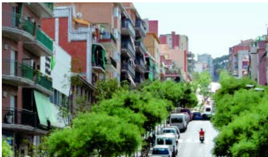
El carrer Llobregós és un dels principals eixos del barri.

Dins del procés de revisió del planejament urbanístic al barri del Carmel, el passat 15 de març es va procedir a la suspensió preventiva de noves llicències d'edificació en determinades illes del barri. La finalitat és garantir que en el futur es pugui disposar d'espais que siguin necessaris per a l'obertura de noves places i carrers, la construcció d'equipaments públics i d'habitatge protegit, entre d'altres. Aquesta suspensió no afecta les actuacions en interiors d'habitatges que no modifiquin estructures ni façana i les actuacions necessàries per qüestions de seguretat i salubritat, com ara reparació de façanes perilloses, cobertes i sanejament, entre d'altres.