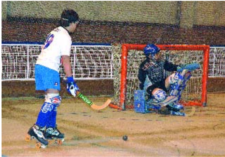
La UE Claret té 55 anys d'història.

Arboix explica com els seus equips participen en dues competicions ben