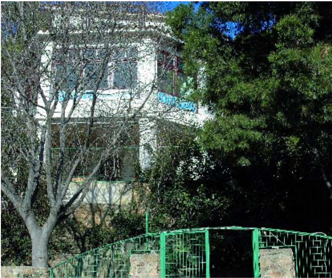
El casal La Miranda aspira a convertir-se en punt de referència de la vida social a la Salut.

El Districte ha impulsat un Pla de Desenvolupament Comunitari del barri de la Salut, que té com a objectiu millorar la qualitat de vida dels veïns a partir de la consolidació de les xarxes de relació social