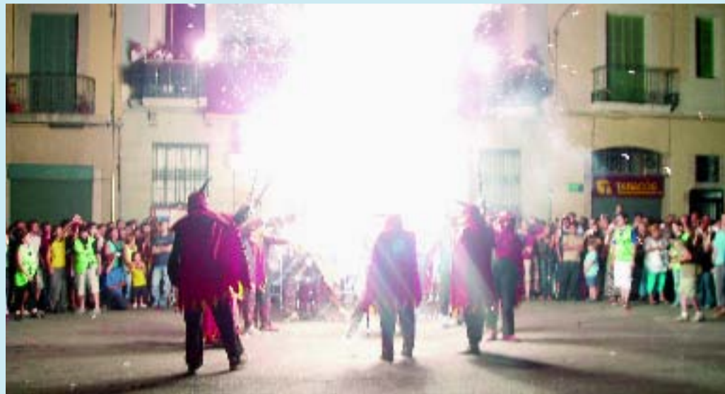
Actuació de la colla de diables la Vella de Gràcia.

La Vella de Gràcia va néixer el 1981. És una de les colles de diables més antigues de la ciutat de Barcelona