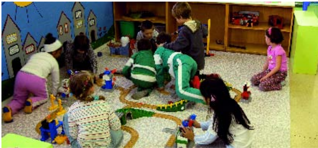
Nens i adolescents a la ludoteca del Centre Cívic El Coll.

Paral·lelament a l'estudi, els tutors dels alumnes de Primària i Secundària dels col·legis de la zona els han lliurat unes enquestes que han de contestar els pares a fi de generar a casa un debat sobre els usos del temps a l'àmbit familiar. Els resultats encara no s'han fet públics, però algú pot dubtar que la tele i els videojocs no seran els principals protagonistes de les hores d'oci?