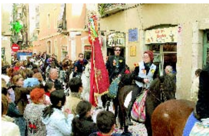
Al matí, cada colla fa un recorregut lliure pels carrers.