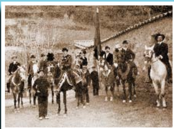
La colla de Sant Medir La Unió Gracienca l'any 1901.

Si té fotografies o documents del seu barri, en pot fer donació a l'Arxiu Municipal del Districte, 93 285 03 57