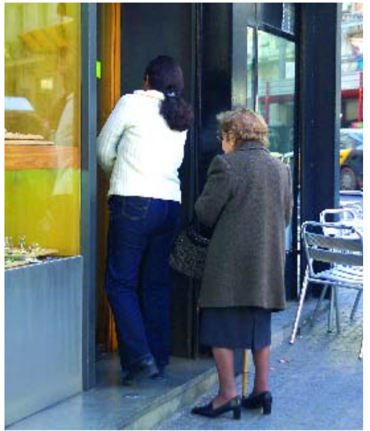
Els treballadors socials ajuden a controlar la medicació de la gent gran.

El 78% dels usuaris són atesos pel Centre de Serveis Socials de Gràcia –que engloba els barris de la Vila i Camp d'en Grassot– i el 22% restant pertanyen als barris de Valcarca, el Coll, la Salut i Penitents.