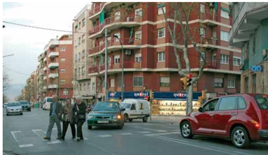
Cruïlla de l'avinguda Mare de Déu de Montserrat amb el carrer la Bisbal.

L'Ajuntament de Barcelona està enllestit el projecte de remodelació de l'avinguda Mare de Déu de Montserrat, una de les principals artèries del Guinardó, que ha quedat massa estreta perquè suporta el trànsit en dos sentits de circulació. Un cop enllestides les obres, els vehicles privats només hi podran circular en sentit ascendent en direcció Llobregat, mentre que els autobusos podran circular-hi en totes dues direccions. A més hi haurà un carril d'aparcament, i els serveis i les voreres seran més amples. El tram entre la plaça de la Font Castellana i el carrer Cartagena seguirà tenint dues direccions per facilitar la mobilitat als carrers de l'entorn.