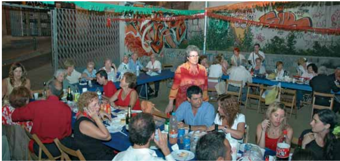
Sopar "Con Traje", per allò de "yo traje...", que recupera l'esperit participatiu dels sopars al carrer.