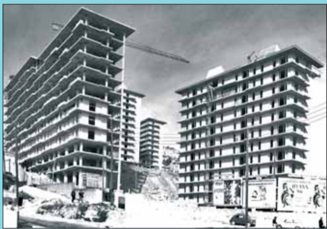
Abans Construcció dels habitatges de la cooperativa a Can Baró l'any 1969. (Esteve Camps)

Si té fotografies o documents del seu barri, en pot fer donació a l'Arxiu Municipal del Districte. T. 93 291 67 26