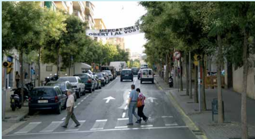
El carrer de Llobregós, obert i ja reformat a principi d'estiu.