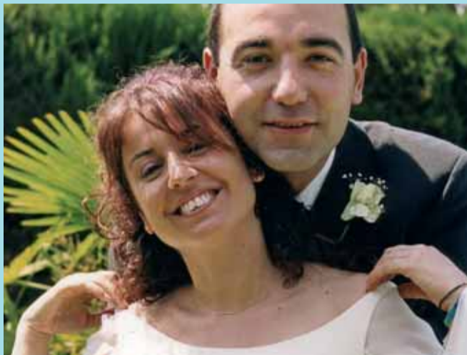
Les parelles tenen més facilitats per casar-se.