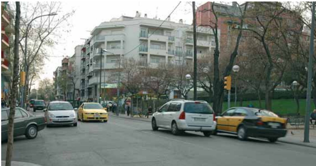
L'avinguda Mare de Déu de Montserrat a l'alçada de la plaça del Nen de la Rutlla.