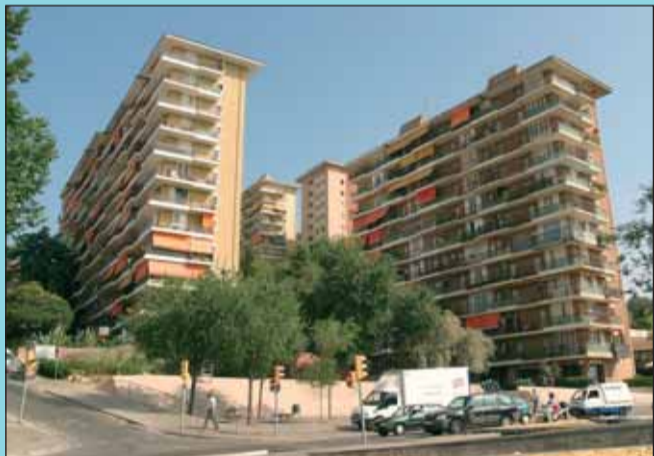
Ara Els habitatges de la Cooperativa Gracienc s'han convertit en un barri del Guinardó.