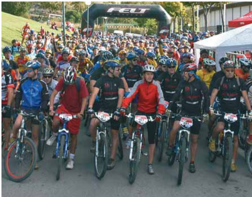
Fotografia dels participants de la cursa.

El circuit té una longitud aproximada de 30 km (encara que se'n pot fer un de més curt, d'uns 22) i estarà convenientment senyalitzat.