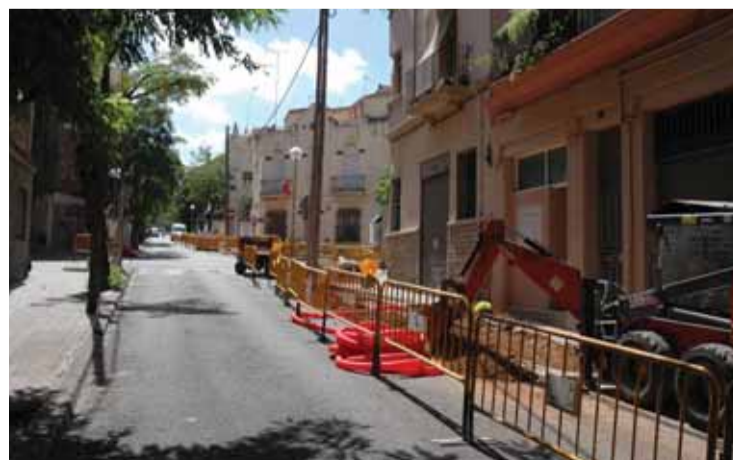
Obres al carrer Mascaró.