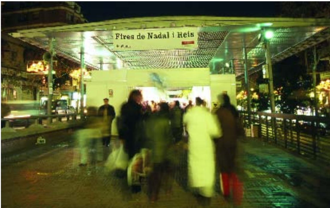
La marquesina de Via Júlia acollirà una nova edició de la Fira de Nadal.