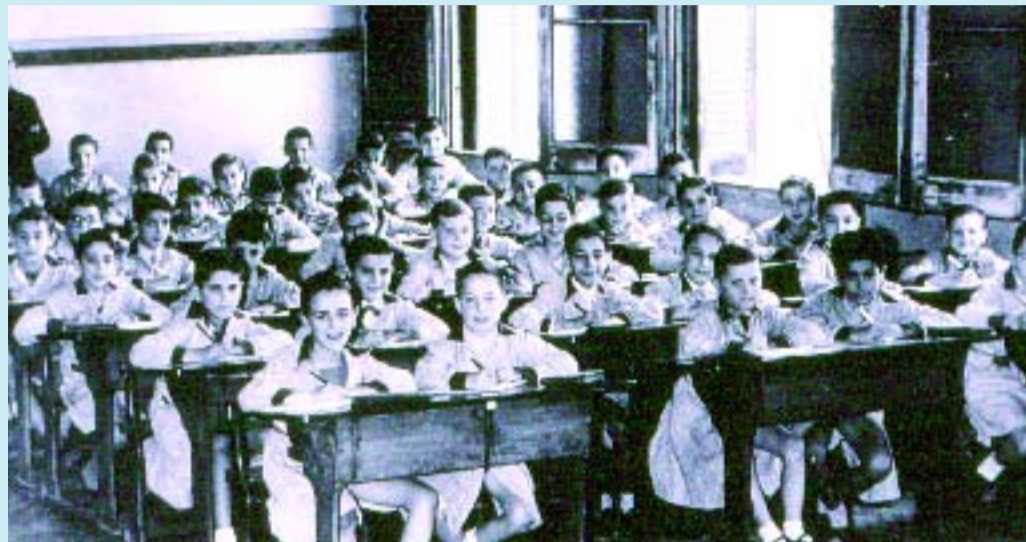
Una de les fotografies de l'exposició.

“Un segle d'escola a Barcelona. L'acció municipal i popular” es pot visitar al pati de la seu del Districte fins al 15 de febrer