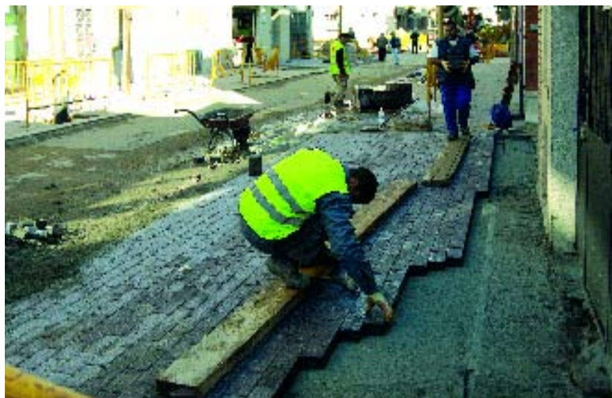
Obres de millora del barri de Prosperitat.

Prosperitat és un barri amb una trama urbana densa que aviat es veurà alleujada. Actualment s'estan duent a terme les obres que convertiran el carrer Santa Engràcia, en el tram que va del carrer Turó Blau fins al de Sant Francesc Xavier, en un carrer amb prioritat per a vianants, tal com ja ho és el tram que va fins a Argullós. Per altra banda, ben a prop d'allà, s'està construint una plaça de més de 2.700 m 2 en l'espai delimitat pels carrers Enric Casanovas, Borràs i Boada. Un cop acabada, aquesta plaça tindrà espais per a diferents usos i tindrà rampes que en salvaran els desnivells i faran que no hi hagi barreres arquitectòniques.