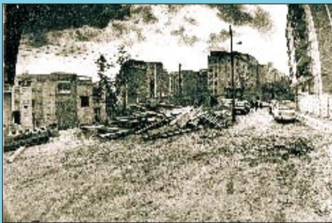
Abans El carrer Valldaura en les obres d'urbanització al començament dels anys noranta.

Si té fotografies o documents del seu barri, en pot fer donació a l'Arxiu Municipal del Districte, 93 205 41 04