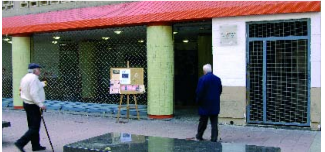
Entrada al Centre Cívic Zona Nord.