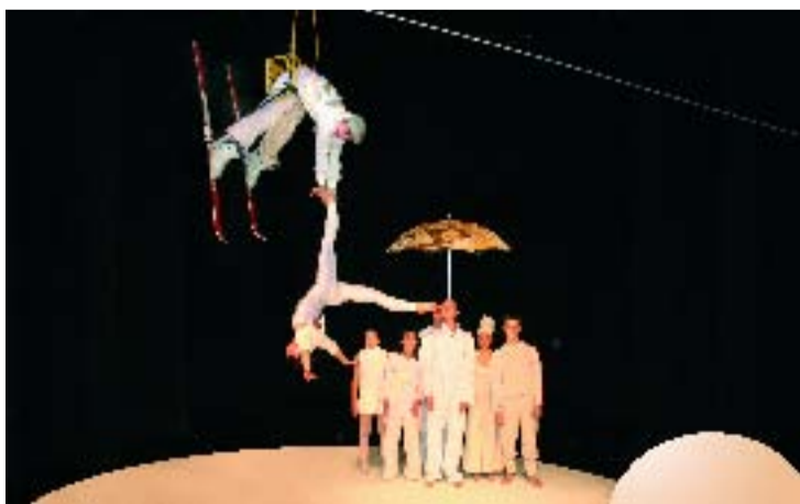
"Circus Klermer", el Circ d'Hivern del 2004.