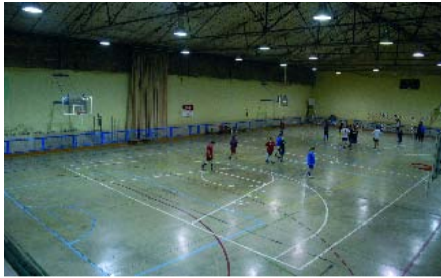
Imatge actual del pavelló.

Aquestes millores de condicionament general del poliesportiu han estat adjudicades a l'empresa Servi-