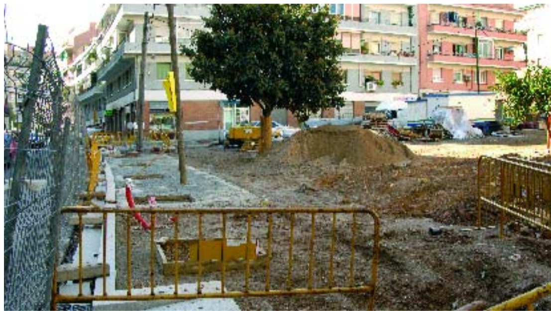
La nova plaça s'està construint entre els carrers Enric Casanova, Borràs i Boada.

La trama urbana de Prosperitat millorarà sensiblement gràcies a l'actuació d'esponjament que s'està duent a terme a l'espai delimitat pels carrers Enric Casanovas, Borràs i Boada. La nova plaça que s'hi està construint tindrà un gran espai central de sauló i gespa, que estarà combinat amb una important plantació d'arbres amb espècies de fulla caduca i d'altres de perennes. També tindrà àrees de descans i espais amb jocs infantils. Tot plegat es combinarà amb altres zones pavimentades. Un cop acabada, la plaça aportarà un nou espai de 2.775 m 2 de lleure per al barri de Prosperitat, que ajudaran a esponjar una mica la densa trama urbana d'aquest barri. El pendent de la plaça quedarà salvat a través de rampes que faran també que aquest espai estigui lliure de barreres arquitectòniques.