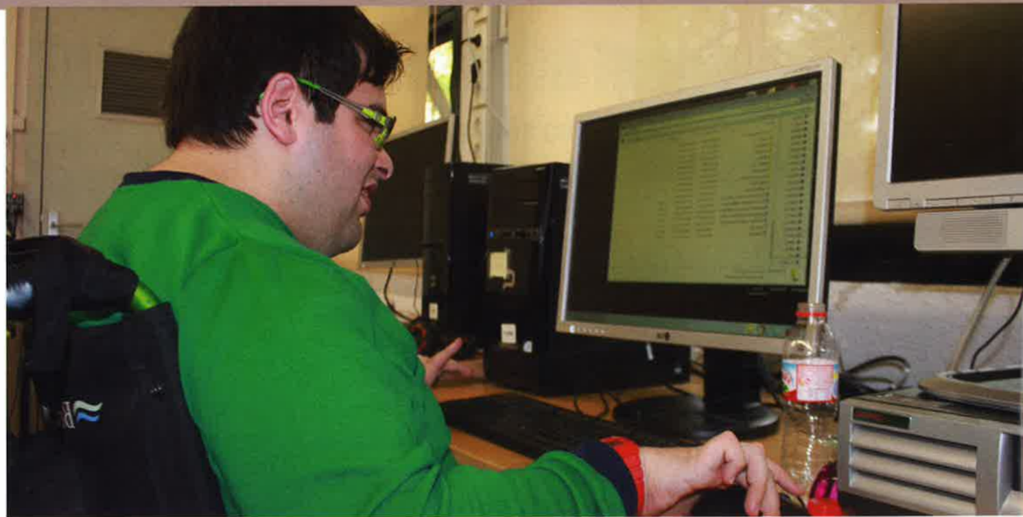
A l'esquerra, un alumne s'esforça amb tenacitat per complir amb la seva tasca informàtica. Les imatges centrals corresponen al material electrònic