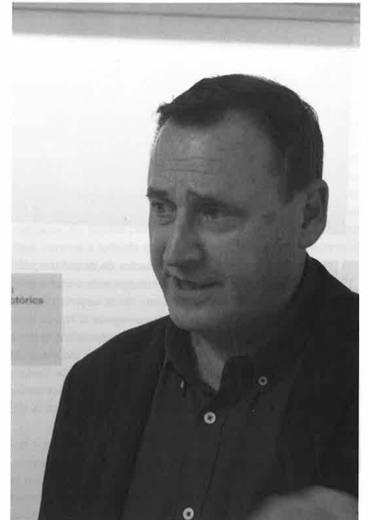
cap a peu i febrer

Per sort, no tan com en altres sectors. Sempre hi hagut una certa sensibilitat cap a l'educació social, especialment a Catalunya.