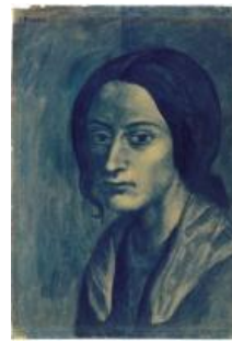
La mujer del mechón de cabellos, 1903