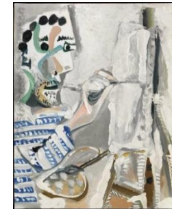
Pintor trabajando, 1965