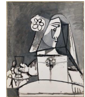
Las Meninas, 1957

Nota: Las obras escogidas pueden ser susceptibles de cambio, según las necesidades del Museo