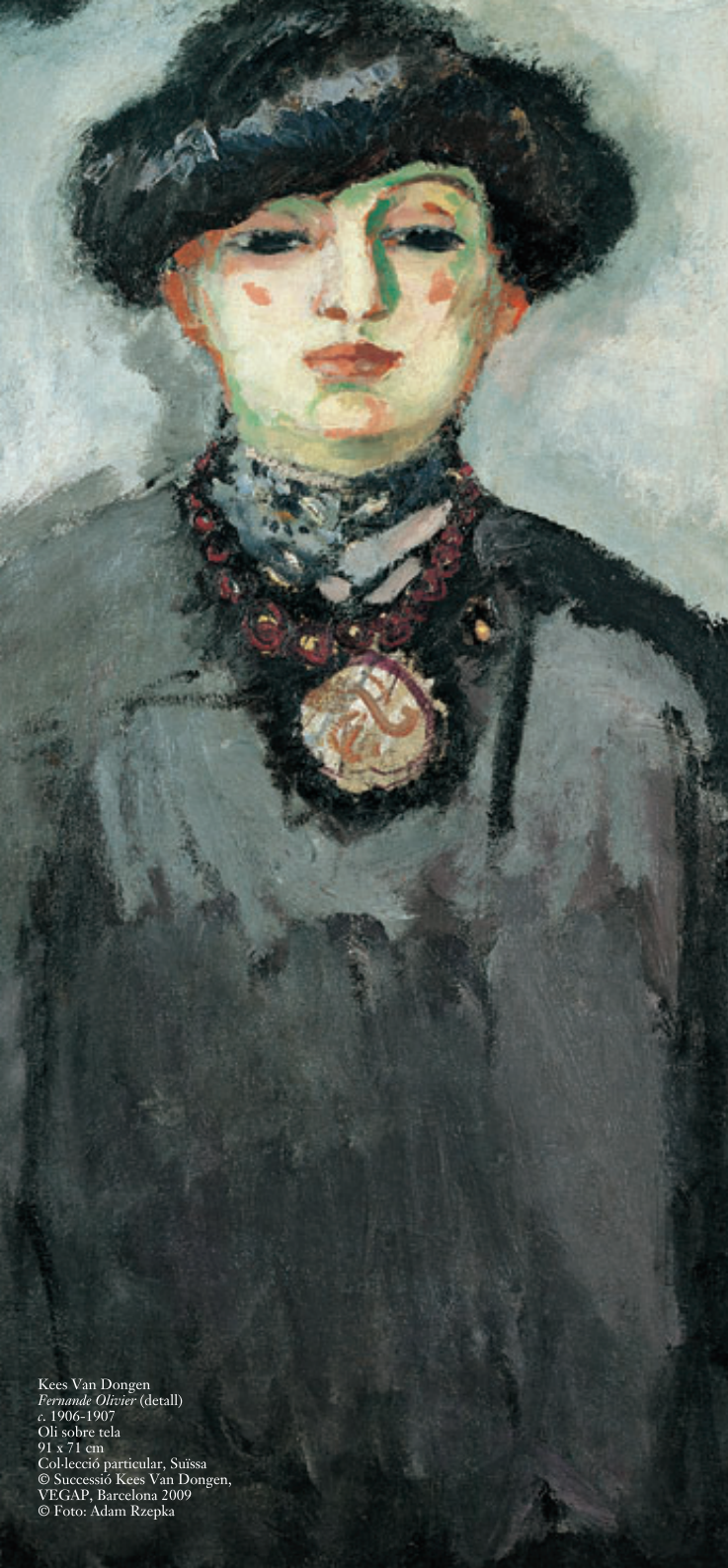
Kees Van Dongen Fernande Olivier (detall) c. 1906-1907 Oli sobre tela 91 x 71 cm Col·lecció particular, Suïssa © Successió Kees Van Dongen, VEGAP, Barcelona 2009