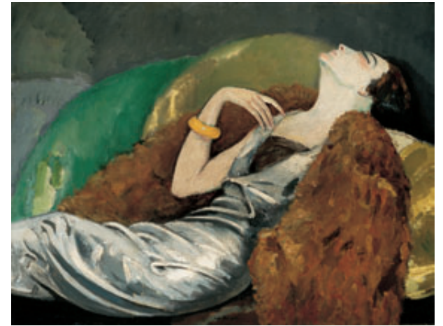
Kees Van Dongen DONA EN UN CANAPÈ c. 1930 Oli sobre tela 89,2 x 116,8 cm Musée des beaux-arts de Montréal Inv. 1978.21 © Successió Kees Van Dongen VEGAP, Barcelona 2009

Van Dongen coincidió por un tiempo con Picasso en el Bateau-Lavoir, y las relaciones personales y estéticas que mantuvieron son abordadas detalladamente en esta muestra.