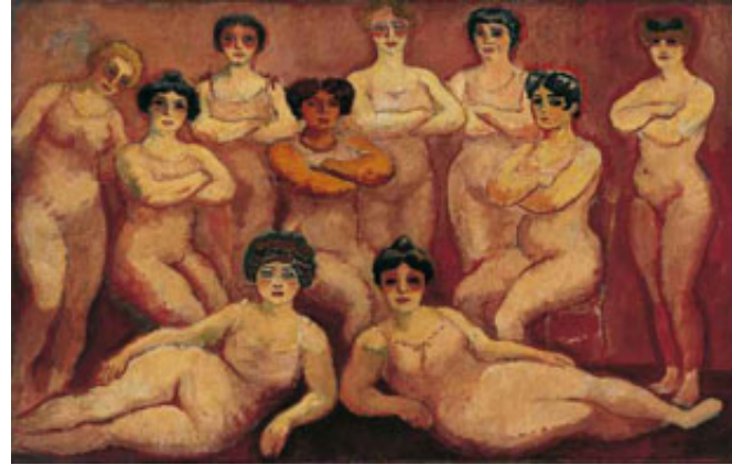
Kees Van Dongen LES LLUITADORES O LES LLUITADORES DE TABARIN 1907-1908 Oli sobre tela 105,5 x 164 cm Nouveau Musée National de Monaco Inv. 2008.7.3

L'exposició confirma el lloc determinant que va ocupar Kees Van Dongen a les grans agitacions artístiques de principis del segle XX, especialment dins del fauvisme, on va tenir aquest paper únic de retratista sovint irreverent i feridor.