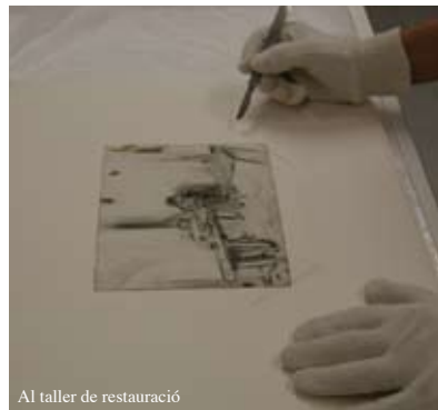
Al taller de restauració

Finalitzat el curs, el Museu Picasso ofereix la possibilitat, que algun/s alumne/s facin pràctiques professionals al museu (subjecte a perfil i expedient acadèmic, necessitats del museu, etc.)