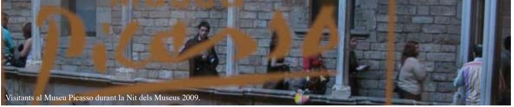
Visitants al Museu Picasso durant la Nit dels Museus 2009.