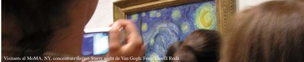
Visitants al MoMA, NY, concentrats davant Starry night de Van Gogh.