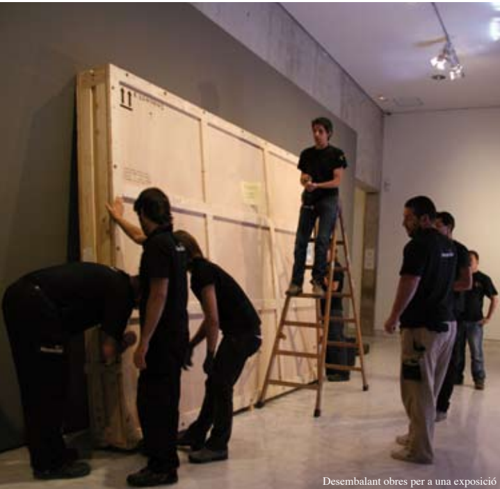
Desembalant obres per a una exposició