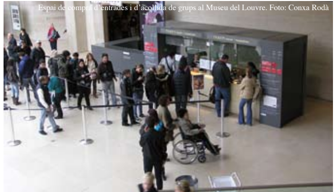
Espai de compra d'entrades i d'acollida de grups al Museu del Louvre.

Fora d'aquest horari, es farà una o dues visites a museus i exposicions per mes.