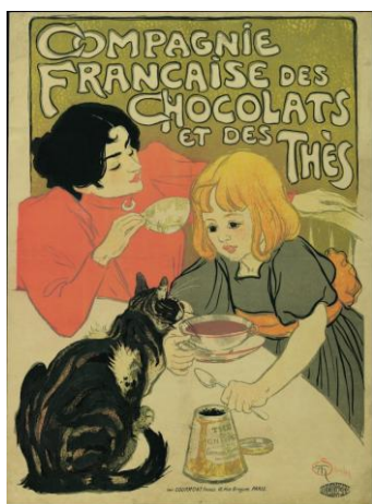
Theophile-Alexandre Steinler, cartell publicitari de la Compagnie Française des Chocolats et des Thés. Litografia, 80 x 60 cm. Museum für Gestaltung Zürich Plakatsammlung Franz Xaver Jaggy © ZHdK

Poc després de dibuixar Home arrepenjat en una paret , Picasso entra en contacte amb l'actiu món de les arts gràfiques de Barcelona. La necessitat de guanyar diners el porta a participar en concursos de cartells, a fer targetes comercials o a dissenyar menús. Un dibuix de l'època, on el pintor escriu repetidament "Fabrica de dibujos Pablo Ruiz Picasso Barcelona", amb un tipus de lletra que fa pensar en un anunci, reforça aquesta idea. Cap al 1899, el jove Picasso mostra un gran interès per l'"artista de quiosc" Théophile-Alexandre Steinlen; n'escriu reiteradament el nom en un full i el cita de manera indirecta en un retrat del seu pare amb el Gil Blas Illustré , una de les publicacions on col·laborava Steinlen.