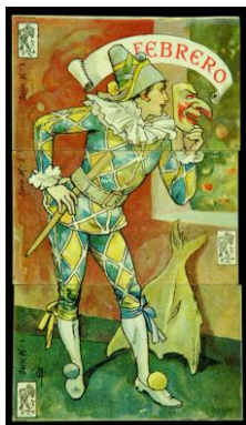
Apel·les Mestres , «Febrero» (tres cromos de Chocolate Amalher per a la sèrie «Los meses»), 1906. Cromolitografia sobre cartolina, 9 x 14 cm (cadascun). Biblioteca de Catalunya, Barcelona

A la Barcelona del 1900, les arts gràfiques viuen un moment de gran prosperitat i el cromo n'és una peça important. Gairebé tots estan lligats a productes comercials, però els de més anomenada són els de la xocolata i les caps de mistos. Els cromos es col·leccionen en àlbums temàtics de pàgines sovint estampades amb dibuixos, sobre els quals s'enganxen els petits impresos. Aquesta relació entre imatge dibuixada i imatge fotogràfica reproduïda mecànicament fa pensar força en la que Picasso estableix en el seu dibuix.