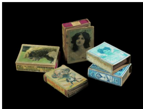
Capses de mistos amb cromos d'artistes i caricatures de personatges de l'època , c. 1900, 6 x 4 x 1,3 i 5 x 3,7 i 5 cm. Museu Frederic Marès, Barcelona