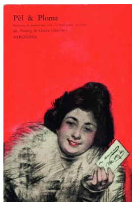
Ramon Casas, Postal publicitària de Pèl & Ploma, 1900-1905. Litografia sobre cartolina 14 x 10 cm. Biblioteca de Catalunya, Barcelona.

Després encara col·labora al diari El liberal (1902), per al qual havia dissenyat un projecte de cartell, i a diverses revistes populars franceses, com el setmanari Frou-frou , que li publica quatre dibuixos entre 1901 i 1903.