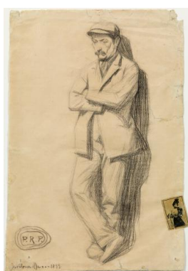
PABLO PICASSO , Home arrepenjat en una paret . Barcelona, març del 1899 Llapis Conté sobre paper i il·lustració enganxada al marge dret, 49 x 32,7 cm Museu Picasso, Barcelona. © Successió Pablo Picasso, VEGAP, Madrid 2012

El dibuix Home arrepenjat en una paret forma part d'una sèrie d'estudis del natural que Picasso fa al Cercle Artístic de Barcelona entre febrer i març del 1899, un moment crucial en què el jove artista decideix, contra la voluntat del pare, abandonar els estudis acadèmics i iniciar la carrera de pintor independent. La petita peça encolada a la part inferior dreta és un cromo de caps de mistos d'una sèrie dedicada a artistes de l'espectacle, un tipus d'imatge molt popular a l'època. La figura fotografiada és l'actriu francesa Angeline Cavelle.