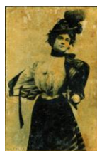
Cavelle (cromo de caps de mistos) . Fototípies sobre paper envernissat, 5,5 x 3,6 cm. C. 1900. MAE. Institut del Teatre, Barcelona