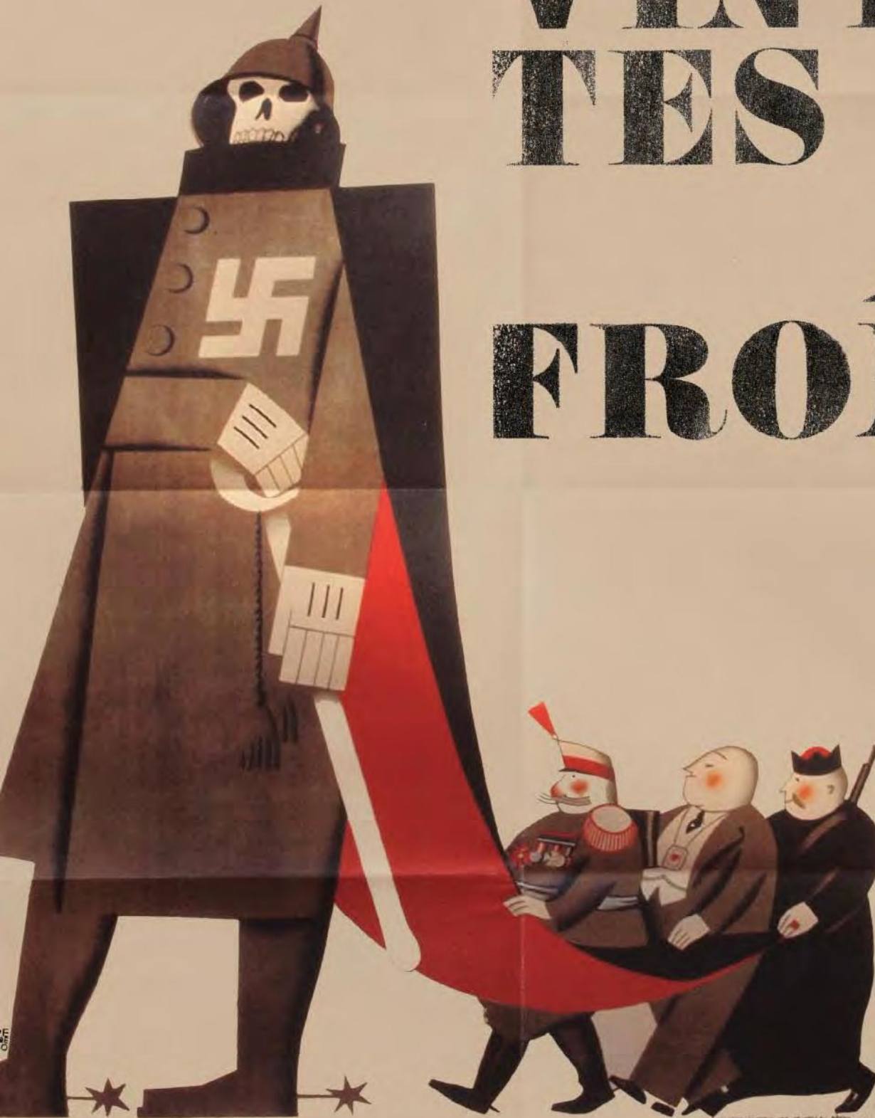
o t t o - o . l a f . c o m | Pedrera, El (Generación del 34), Junta Delegada de Defensa de Madrid, Rueda de prensa, 1937, 100 x 71 cm. Colección Postscript, Barcelona. © Tis al d'Inic. Aurovab