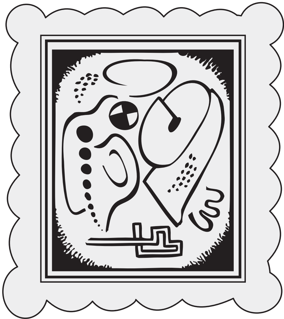
Rodney Graham. Possible abstraction Pair 40 , 2009, poliuretà sobre fusta i polímer acrílic, 244,5 x 215,6 cm. cada panell