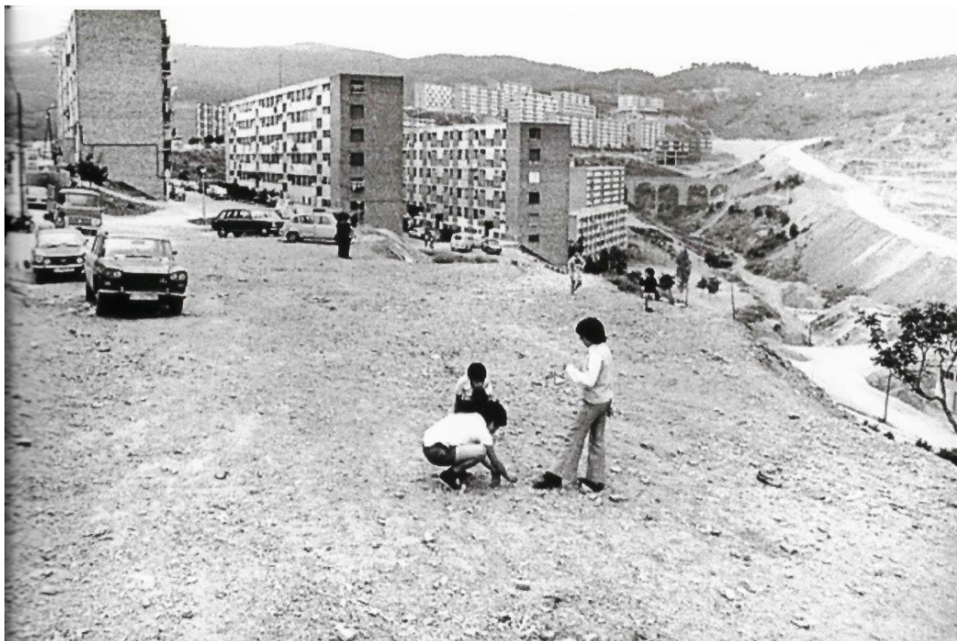
Els descampats al voltant del polígon de Ciutat Meridiana mostren les insuficiències de la gestió per integrar adequadament a la ciutat els nous polígons d'habitatges, un aspecte que els barris vells podien resoldre amb menys dificultats. 1975.

El propòsit de la instal·lació expositiva "Habitar Barcelona. Reptes, combats i polítiques al segle xx" és mostrar les polítiques de construcció i les pautes d'accés a l'habitatge de les majories urbanes al llarg del nou-cents: d'un lloguer sovint inassolible en el primer terç del segle i durant una duríssima postguerra, a una costosa i quasi obligada adquisició del pis en propietat en la represa econòmica del període sense democràcia del franquisme, per acabar amb els avenços en democràcia, més efectius, tanmateix, en la transformació de l'espai públic que en la qüestió de l'habitatge.