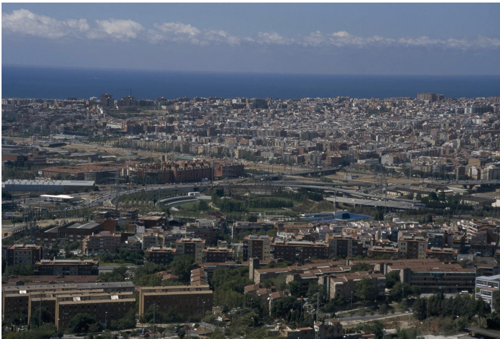
El nus de la Trinitat, símbol dels intents per integrar les grans infraestructures. 1998.

La crisi de 1975 va comportar la fi del desarrollismo , amb una inflació galopant que posà en perill la transició democràtica. A la dècada de 1970 la immigració ja havia aconseguit en gran part d'accedir a un habitatge, sovint de propietat lliure o en modalitats diverses de protecció oficial. Hi havia força desocupació i el pis era el bé més preat de moltes famílies. Gràcies a la pressió del moviment veïnal, s'anaven resolent les reivindicacions d'urbanització i d'equipaments.