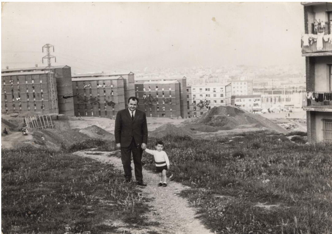
Trinitat Nova, imatge del polígon d'habitatges tot just construït, c. 1960.

Els anys del desarrollismo , el temps de creixement accelerat sense democràcia de 1959 a 1975, es van caracteritzar per la inversió pública en infraestructures i indústries i per l'obertura al turisme. Els planes de desarrollo van incentivar un desenvolupament amb forts interessos corporatius i privilegis particulars. Les taxes de creixement, amb una mitjana anual del 7 %, van fer d'Espanya la cinquena economia continental el 1974 amb una renda per càpita que representava el 79 % de la mitjana europea.