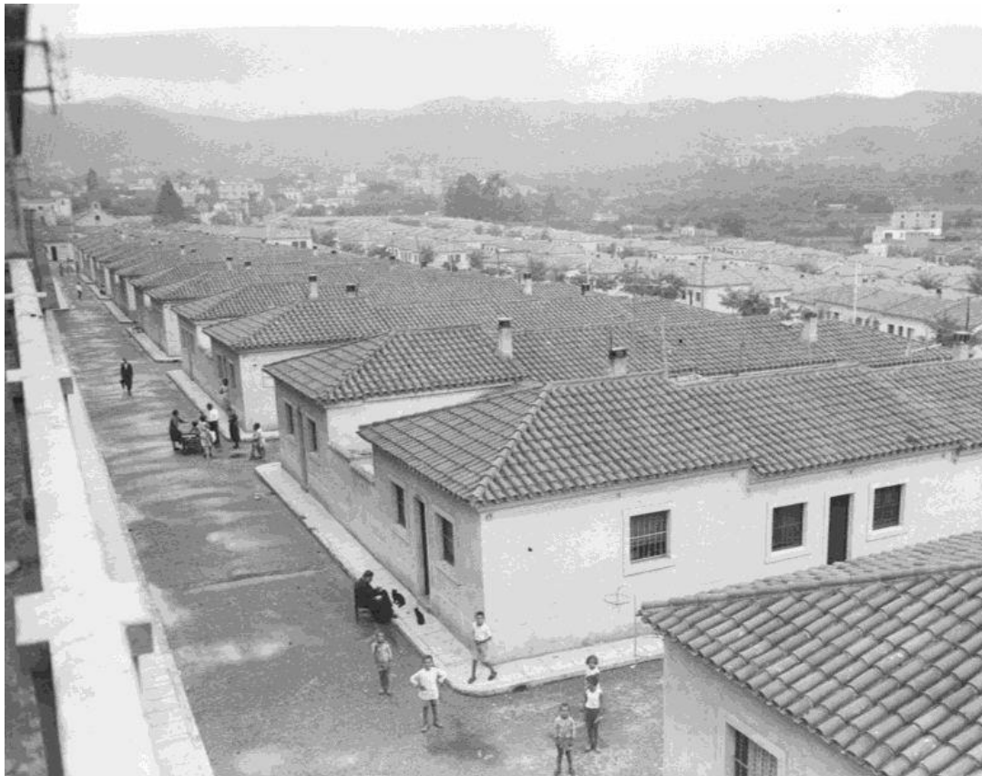
Grups de gent a les portes dels habitatges i nens jugant al carrer de les cases barates de Milans del Bosch, entre el 1930 i el 1932. El barri es va anomenar durant la Segona República Bonaventura Carles Aribau i actualment es diu Bon Pastor.

Les recerques que han permès d'organitzar l'exposició i els materials que la defineixen s'incorporaran a MUHBA Bon Pastor. Es tracta d'un projecte museístic de barri i de ciutat a les Cases Barates, centrat en l'habitatge, que s'inaugurarà el 2023.