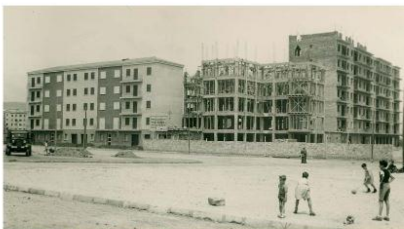
Grup d'habitatges del Congrés Eucarístic, 1962.

amb l'exposició "Alimentar Barcelona", centrada en el paper que va tenir el municipi en la regulació del proximitat urbà. Habitat, menjar, jugar i, ben aviat, protegir, treballar, moure... Al museu s'intenta d'engançar en la recerca per arribar a exposar una història urbana substancial que es pugui compartir amb la ciutadania i sigui ben arrelada en múltiples espais patrimonials de la ciutat.