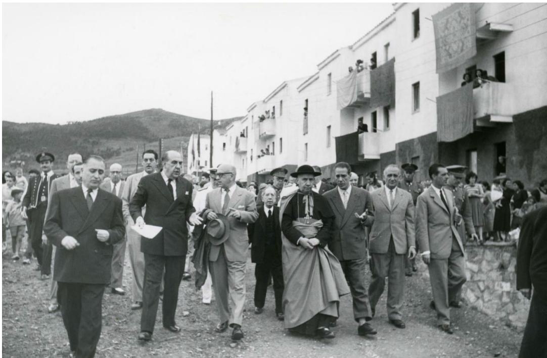
Inauguració dels habitatges del Governador, 1953

Acabada la Guerra Civil i fins ben entrada la dècada de 1950, Barcelona va travessar una de les pitjors etapes de la seva història. S'afegien als estralls de la Guerra Civil la política econòmica autàrquica i la incidència de la Segona Guerra Mundial, fets que abocaven les classes populars a viure al llindar de la subsistència: la qüestió de l'habitatge, doncs, encara es va tornar més dramàtica.