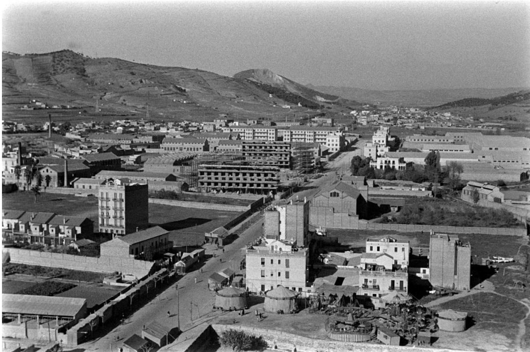
Vista panoràmica de Sant Andreu amb la Casa Bloc en construcció, 1934.

Entre el 1900 i el 1930 Barcelona va experimentar un creixement migratori extraordinari. La població es va doblar fins arribar al milió d'habitants.