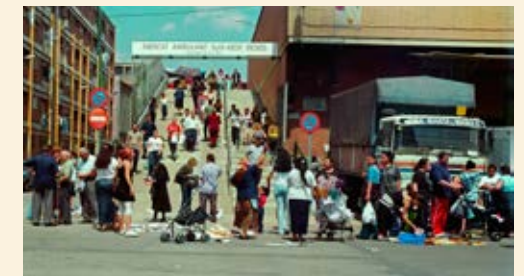
© Patrick Faigenbaum i Joan Roca

Crònica de la transformació del front litoral barceloní, considerada com un procés unitari que afectava barris i situacions molt diferents. Una crònica en què la ciutat es mira en el seu conjunt des de la perifèria. El projecte, obra del fotògraf Patrick Faigenbaum i l'historiador Joan Roca, es va desenvolupar entre 1999 i 2007. L'exposició del treball, comissariada per Jorge Ribalta, és organitzada per La Virreina Centre de la Imatge. Vegeu el web i programa de La Virreina Centre de la Imatge.