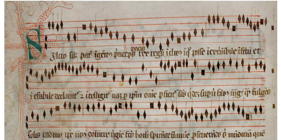
Polifonia de l'Ars Nova ( Missa de Barcelona ), 1396-1410. Biblioteca de Catalunya (detall)