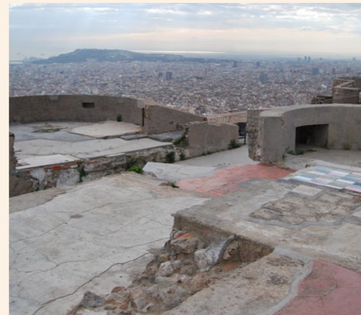
Turó de la Rovira.

Dijous 4 i dijous 11 de desembre, de 18 a 19.30 h Preu: 13,50 € (estudiants, aturats i jubilats: 6,75 €) Lloc: MUHBA Plaça del Rei, sala de Martí l'Humà