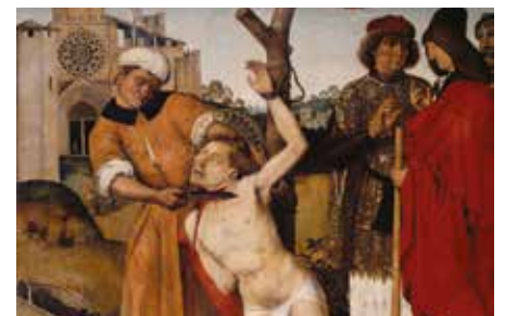
Ayne Bru, Martiri de sant Cugat (detall), 1502-1507. Museu Nacional d'Art de Catalunya