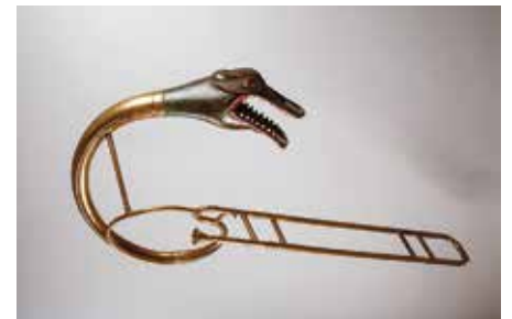
Buccén, Espanya o França, 1800-1860. MDMB 534. Museu de la Música de Barcelona.