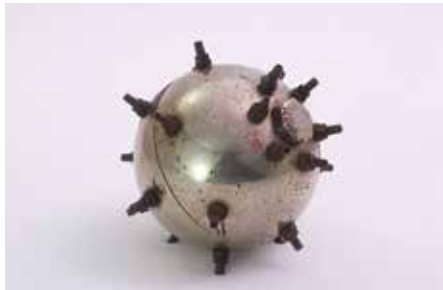
Bomba tipus Orsini. MUHBA.