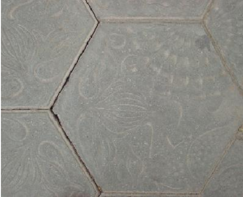
Rajola de la vorera del Passeig de Gràcia

L'autor, tant dels fanals com de les rajoles va ser Antoni Gaudí, com es pot observar a la fotografia el fanal, d'un color marró, està ple d'ornaments en forma de fulles i branques que em recorda a un arbre. A dalt del tot hi ha una mena d'escut, suposo que el de la ciutat de Barcelona amb una corona i un ocell al damunt. Dos llums hi pengen, un a dalt del tot donant al costat per on passen els cotxes i l'altre a mitjana alçada donant a la vorera per on passen els transeünts.