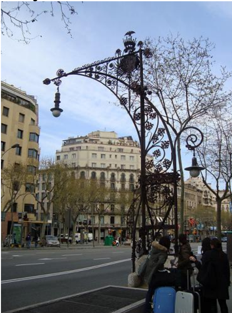
Fanal del Passeig de Gràcia