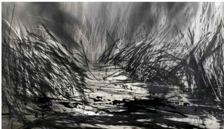
Bassal de sang

94x70 cm Pólvora i grafit sobre paper 2012