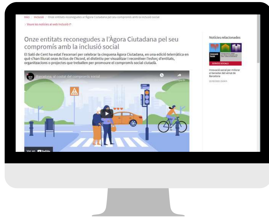
Ajuntament de Barcelona