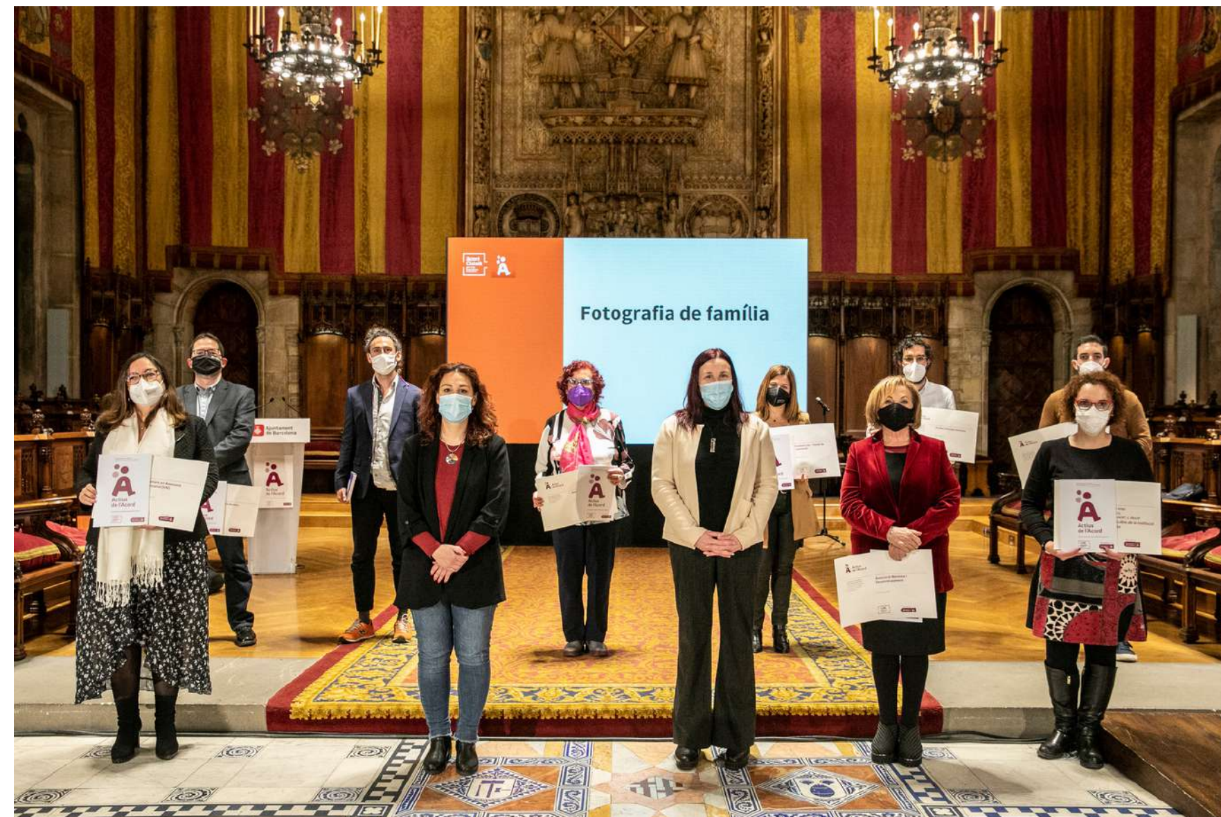
Fotografia de família. Representants de les entitats distingides amb l'Actius de l'Acord juntament amb la Tinenta d'Alcaldia de Drets Socials i la Comissionada d'Acció Social.

ABD Asociación Bienestar y Desarrollo Entidad declarada de Utilidad Pública