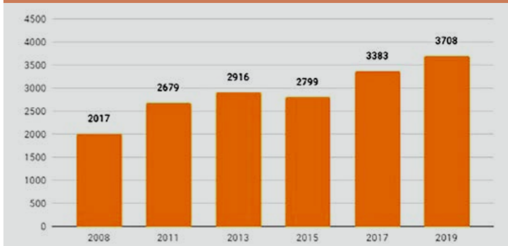
Gràfic 2.1 Evolució del nombre total de persones sense llar a Barcelona. 2008 - 2019.

Entre parèntesi apareixen les dades de persones pernoctant al carrer segons el Recompte ciutadà realitzat per la XAPSL els anys 2008, 2011 i 2017.