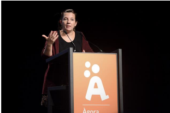
Laia Ortiz , Tinenta d'Alcaldia de Drets Socials i Presidenta de l'Acord Ciutadà

L'Àgora Ciutadana ha servit per mostrar la vitalitat del moviment associatiu de Barcelona. Estem en un moment de reptes globals que tenen un impacte molt concret en la ciutat: parlem de persones que cuiden, persones soles sense vincles, reptes per defensar la ciutat contra l'especulació, etc. Aquesta ciutat té el deure de posar la ciutadania i els drets socials al centre.