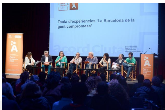
Valoració de l'Àgora Ciutadana 2018