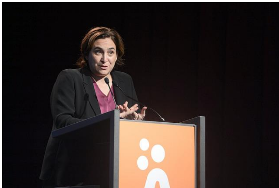
Ada Colau , Alcaldessa de Barcelona

Es va donar la benvinguda a les persones assistents a l'Àgora Ciutadana 2018, un acte que va voler destacar la importància del compromís ciutadà en la defensa dels drets socials.