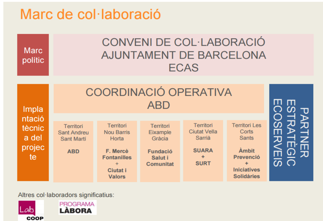
Il·lustració 1. Marc de col·laboració.