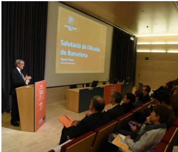
Xavier Trias Alcalde de Barcelona

Continuarem treballant en aquesta línia, donant resposta a les necessitats bàsiques que tenim: feina (promoció econòmica), atendre a les persones més desfavorides (donant serveis bàsics) i habitatge (creant un parc d'habitatge assequible). Conjuntament amb el tercer sector amb una visió a mig llarg termini.