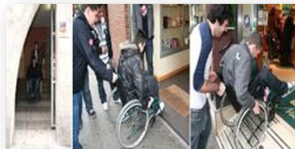
ELS JOVES I ELS ACCIDENTS: les conseqüències